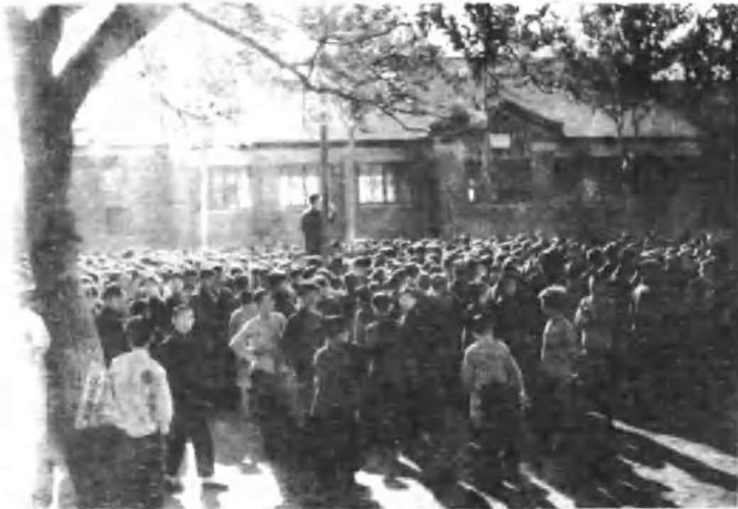
北平汇文中学响应反饥饿反内战运动,进行罢课集会。