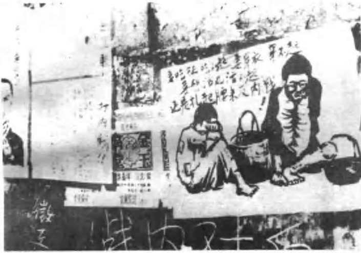
北京大学民主墙上的漫画。