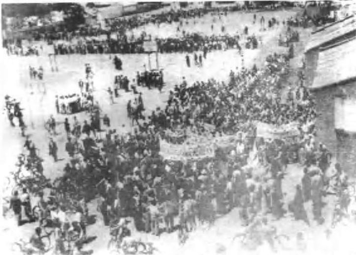
北京大学民主广场上，整装待发的反饥饿反内战示威游行队伍。