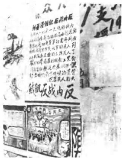
北京大学民主墙上的壁报。