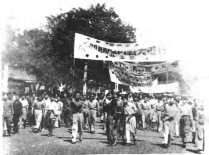
清华大学反饥饿反内战游行队伍。