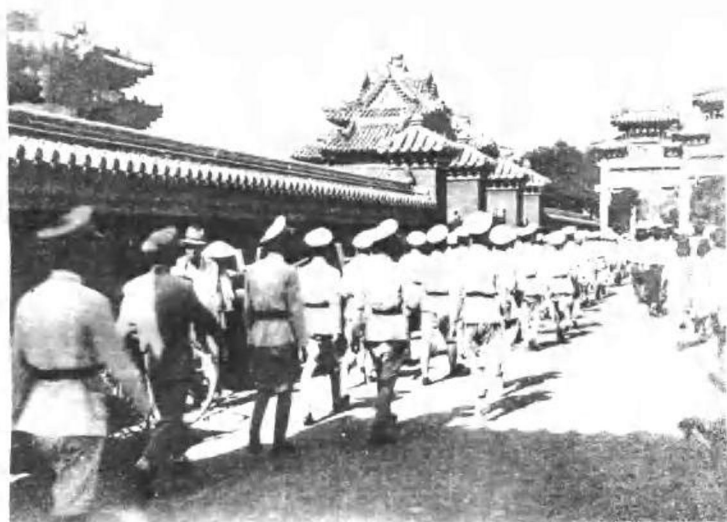
镇压反饥饿反内战运动，北平反动军警出动了。