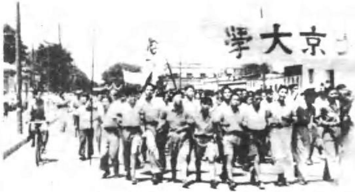
北京大学反饥饿反内战示威游行队伍。