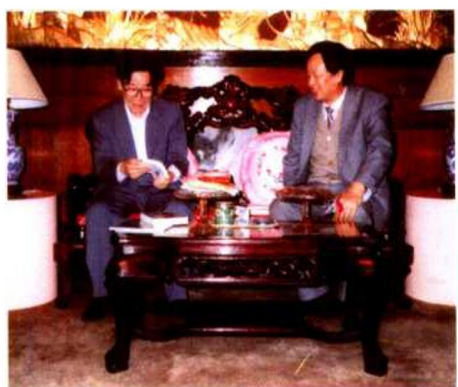
1994年全国政协主席李 瑞环在西安丈八沟接见画家 罗国士