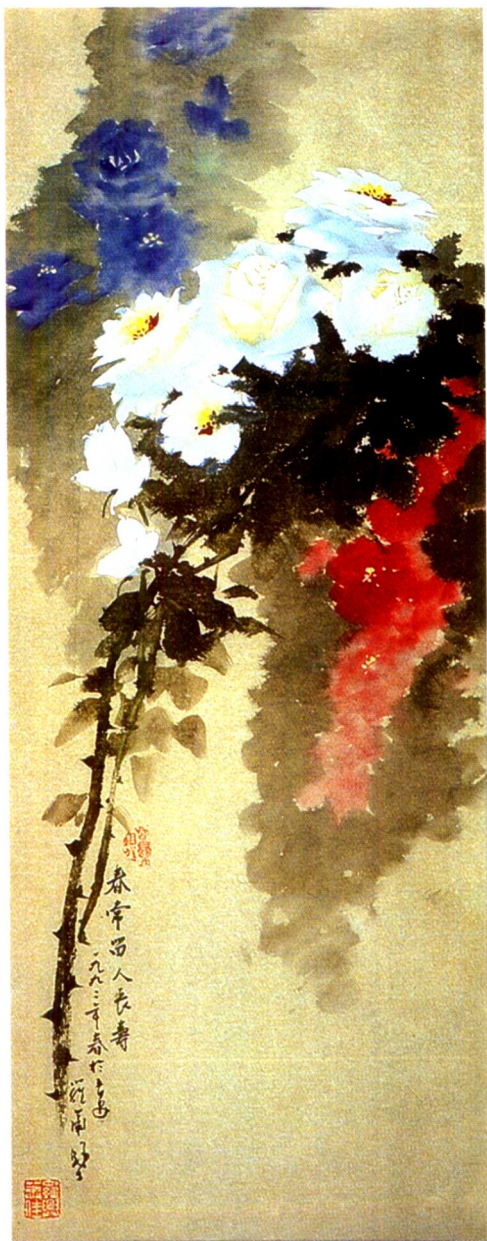
月季：花常好，人长寿