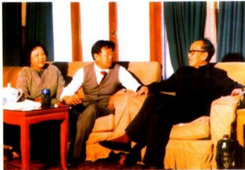
全国政协副主席王任重邀请画家夫妇在家作客