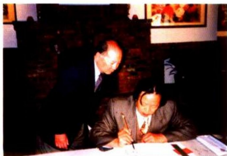
在美国华盛顿展览时中国驻美国大使李道豫为画家罗国士展览作为邀请人