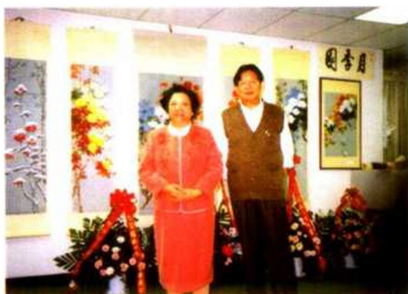
画家夫妇在美国休士顿国际画廊展厅留影