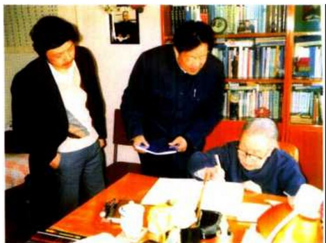
冰心老人为画家罗国士题字 左立者为罗良碧