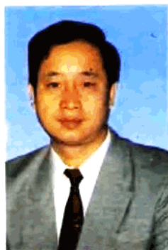
巩义市委书记:武国瑞