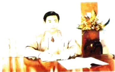
新郑市委书记:岳文海