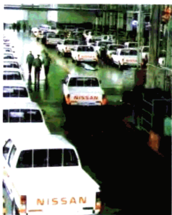
轻汽皮卡生产车间