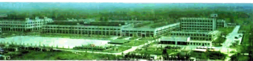
郑州日产汽车公司生产厂区