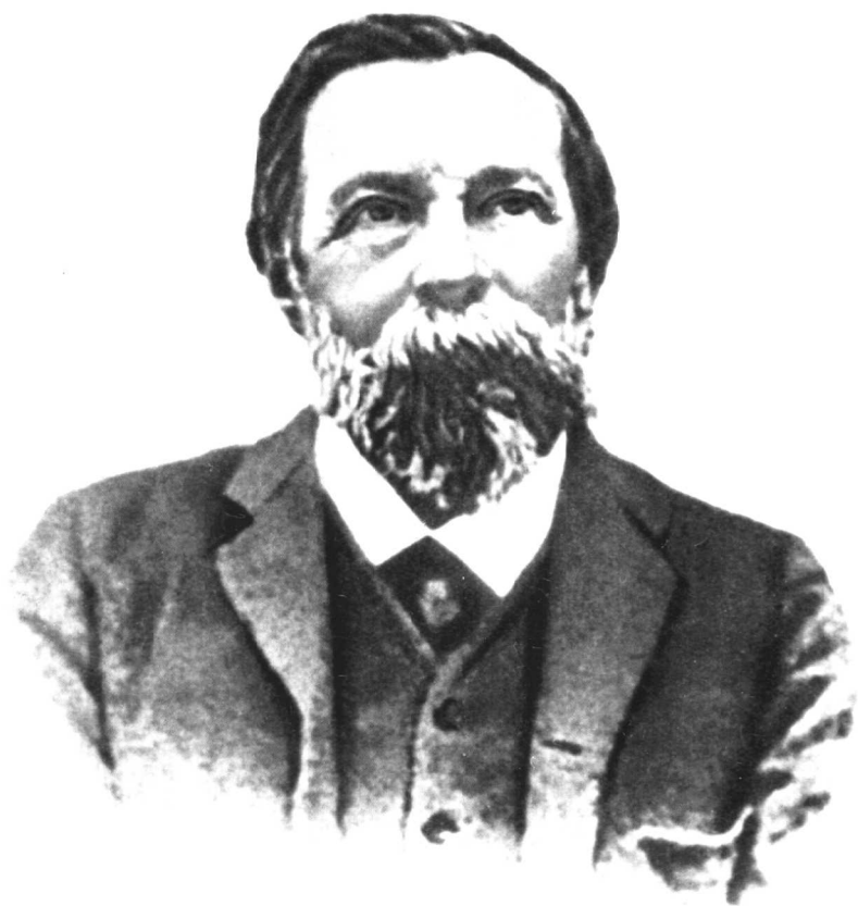
弗里德里希·恩格斯 (晚年)