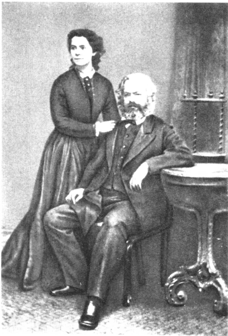
卡尔·马克思和大女儿燕妮 (1869年)