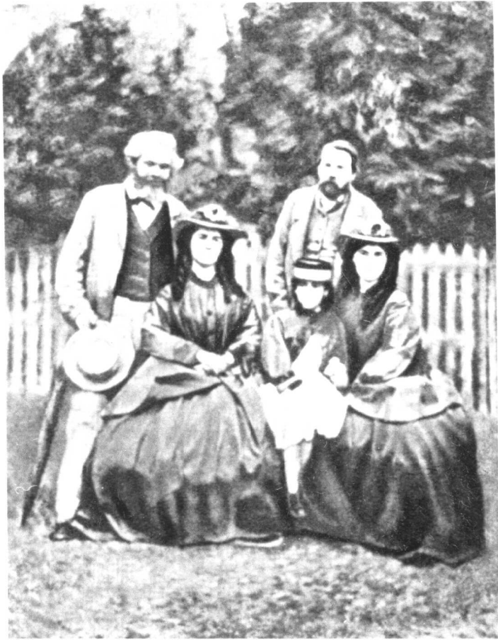
马克思、恩格斯和马克思的三个女儿 ——燕妮、爱琳娜和劳拉(60年代中叶)