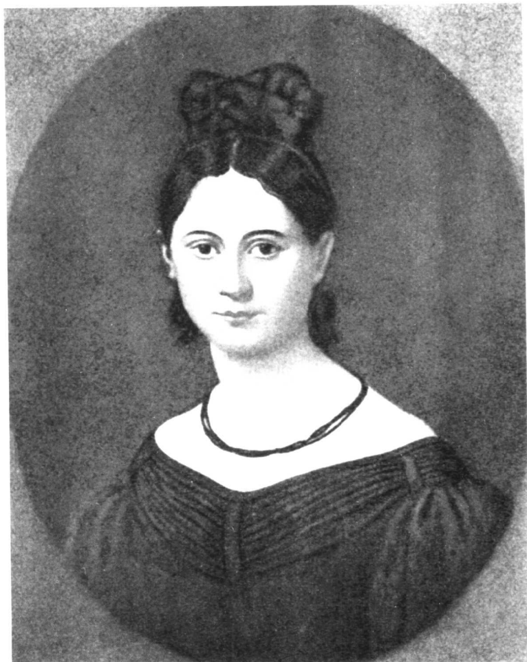
青年时代的燕妮·马克思