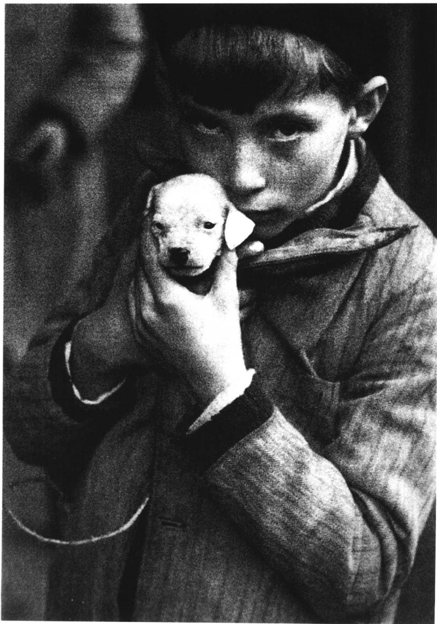
(美国) Andre Kertesz