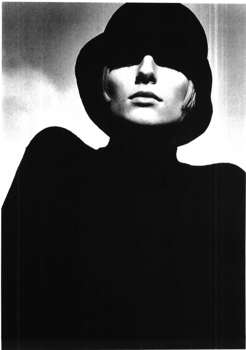
(法国) Jeanloup Sieff