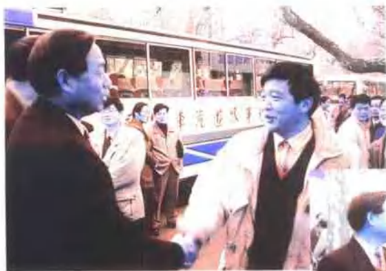
每年春节一过，工作队即赴苏北开展帮扶