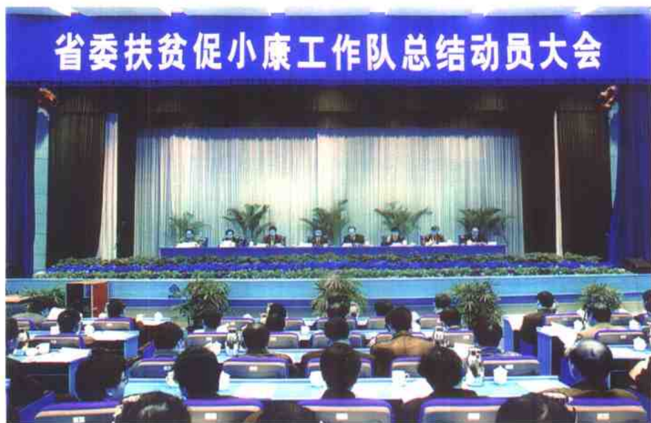
新老工作队员参加总结动员大会

从 1992 - 2001 年，省委连续 10 年向苏北经济落后县派驻扶贫工作队。图为省委副书记李源潮、副省长姜永荣在新老工作队员总结动员大会上发表重要讲话