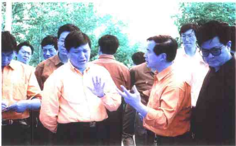
省委副秘书长、省扶贫办主任李继平与当地领导共商农民增收之策