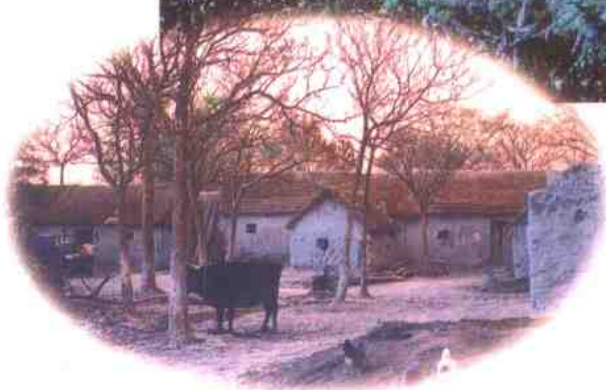
1992年之前，像这样的草危房有104万户，到2000年底，基本完成了草危房改造