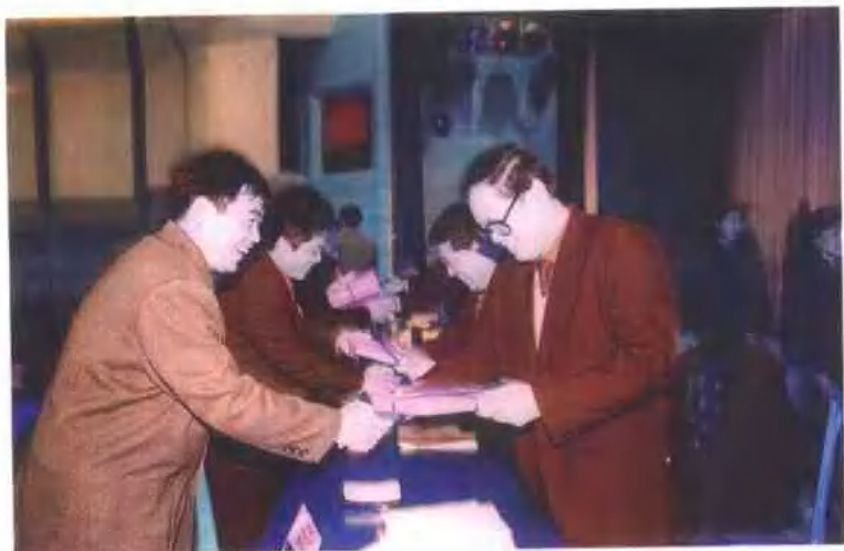
省扶贫工作领导小组每年都向作出贡献的扶贫工作人员进行表彰奖励