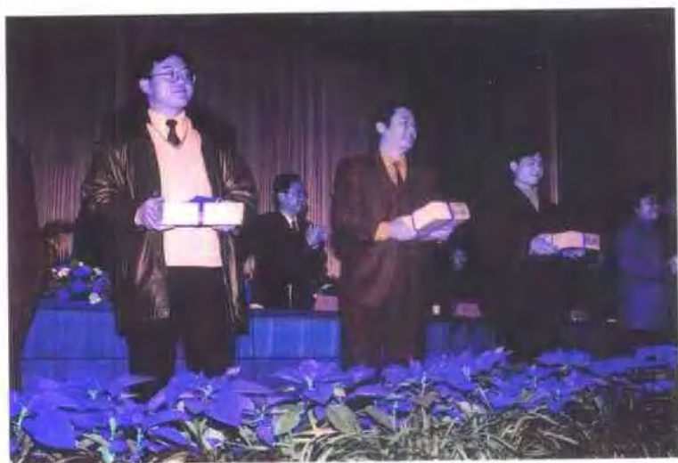
部分受到表彰奖励的扶贫工作人员