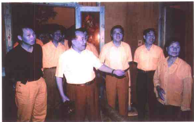
在盱眙县兴隆乡，姜永荣副省长冒雨检查草危房改造情况，并与新建房农户热情交谈