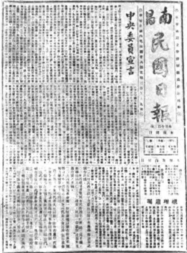
八一起义胜利后，成立革命委员会，发表了中央委员宣言。图为当日南昌民国日报发表的《中央委员宣言》的报道。