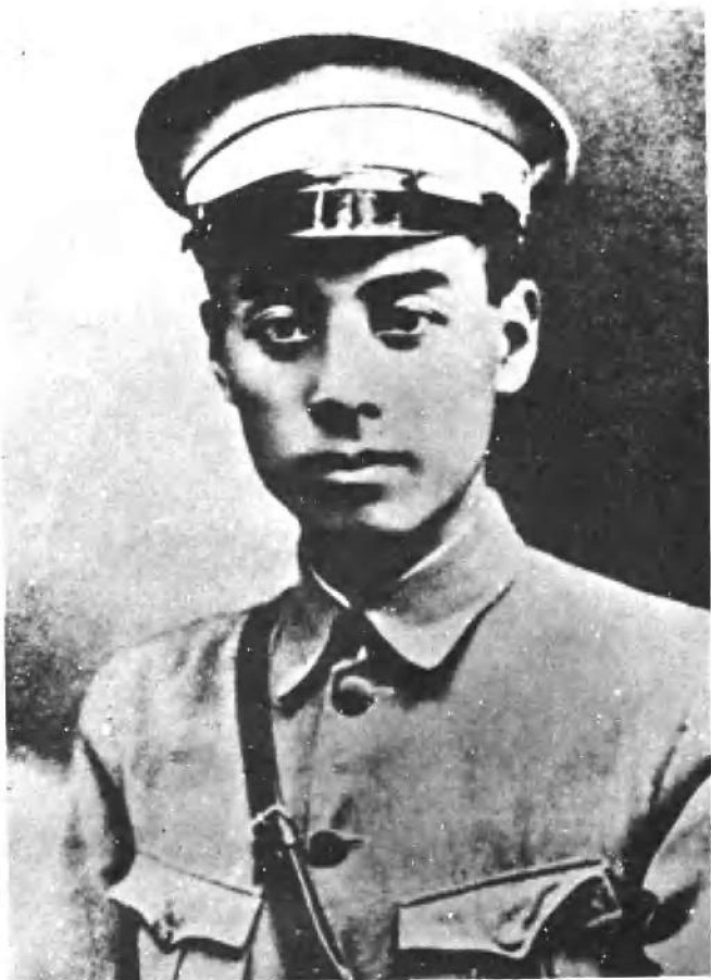
南昌起义主要领导人——中国共产党前敌委员会书记周恩来同志。