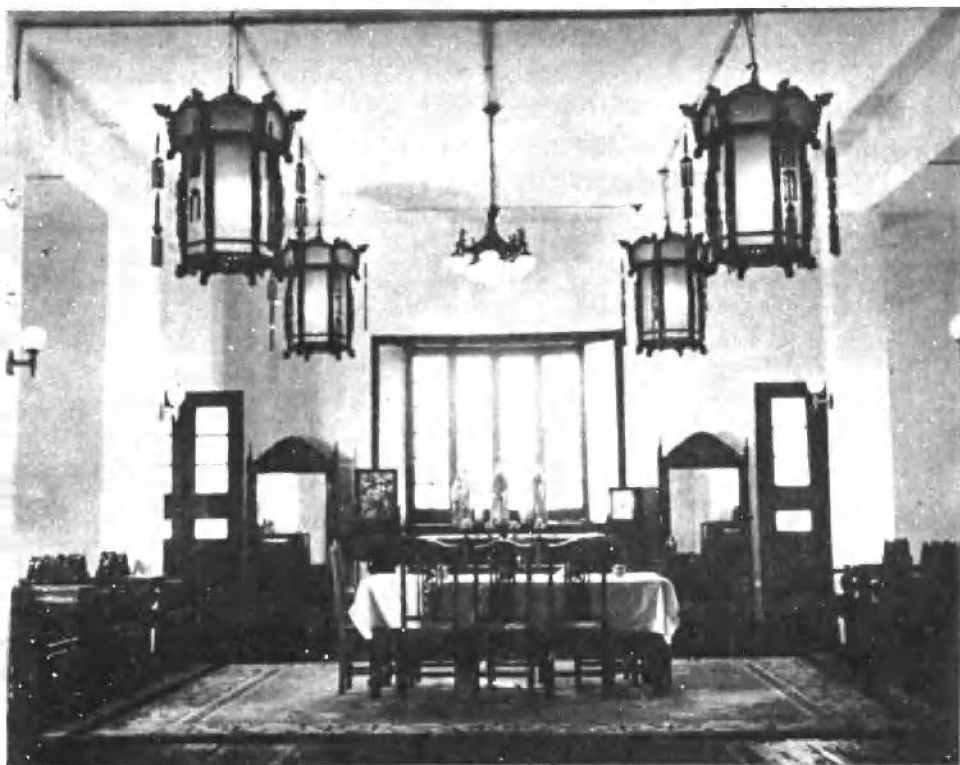
八一南昌起义总指挥部的会议大厅。