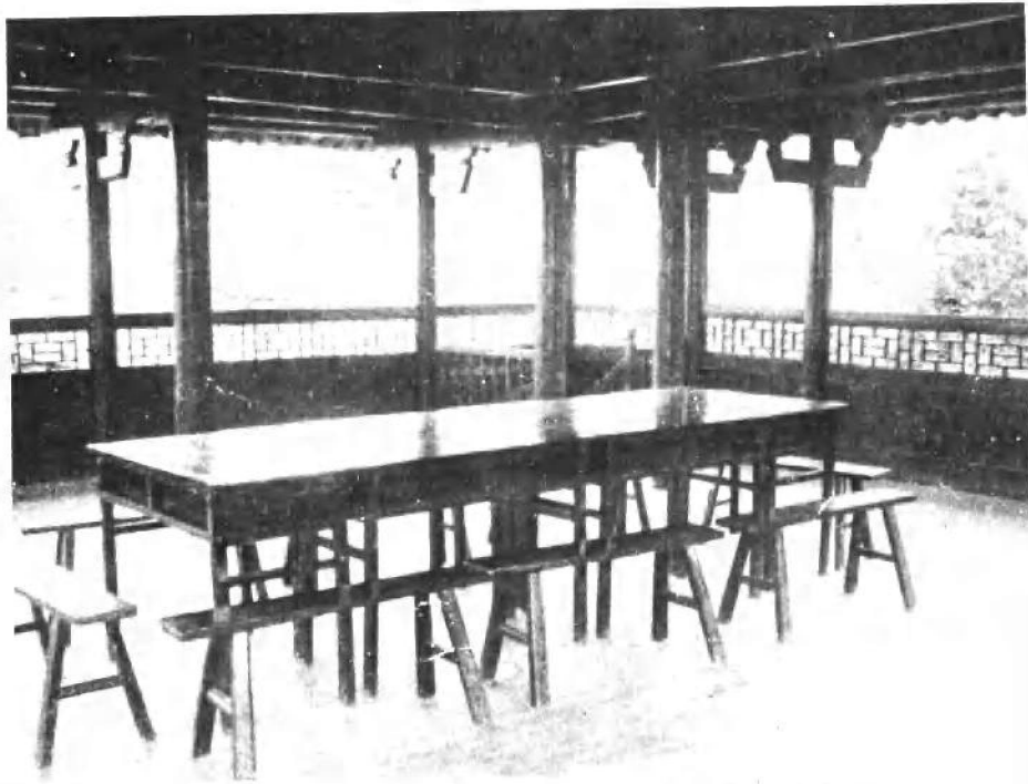
毛泽东同志与朱德同志会见地点——龙江书院文星阁。