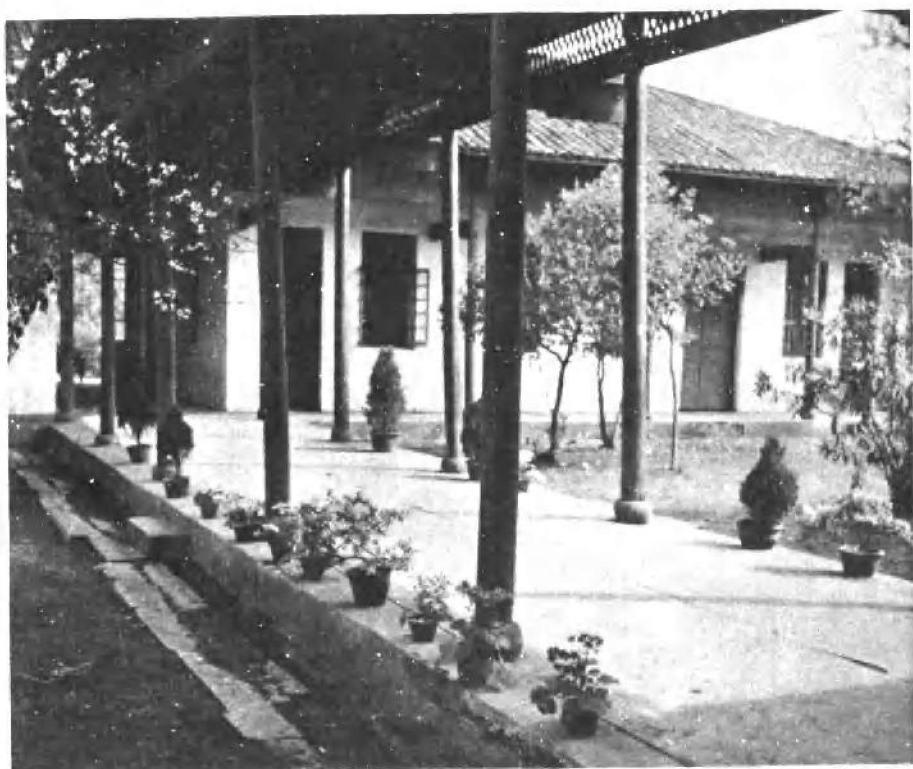
朱德同志一九二七年春在南昌创办的军官教育团旧址。该团在朱德同志的率领下参加了起义，编入国民革命军第九军。