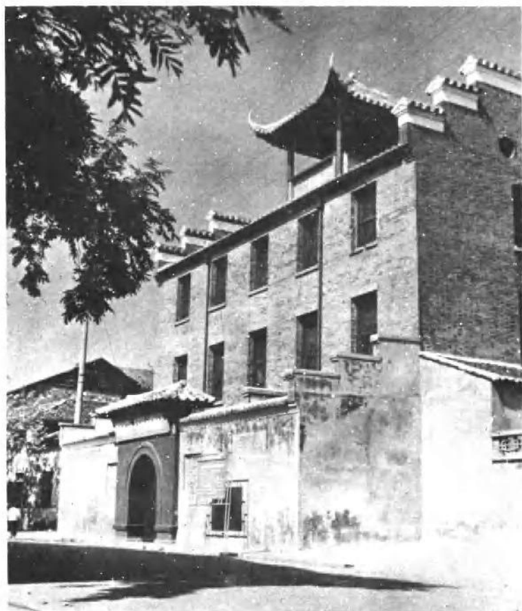
贺龙同志第二十军指挥部旧址。贺龙同志曾在这里召开团以上军官会议，宣布起义计划，部署作战任务，指挥战斗。