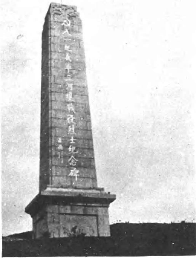
朱德同志亲笔为八一南昌起义军三河坝战役烈士纪念碑的题字。