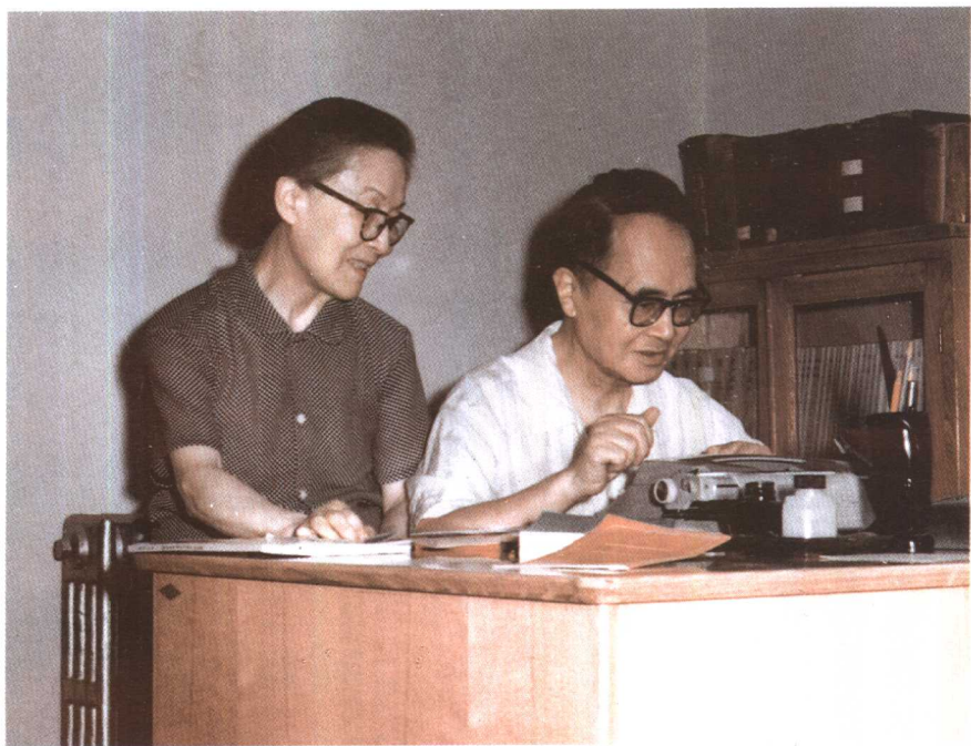
一九八〇年杨绛和钱锺书在家里