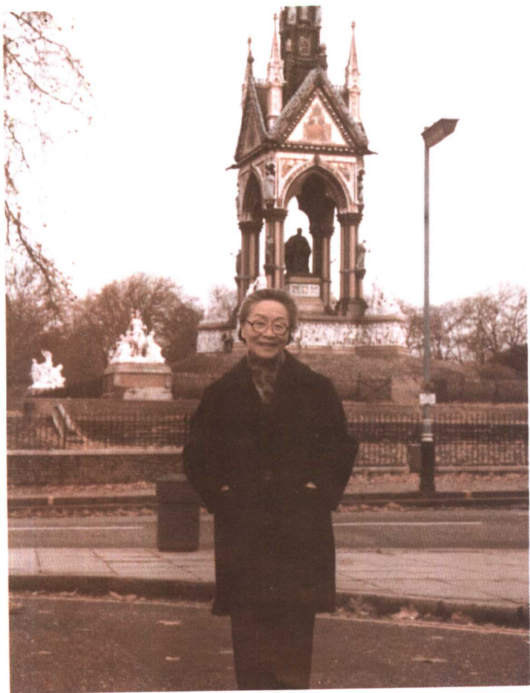
● 一九八三年十一月杨绛在英国