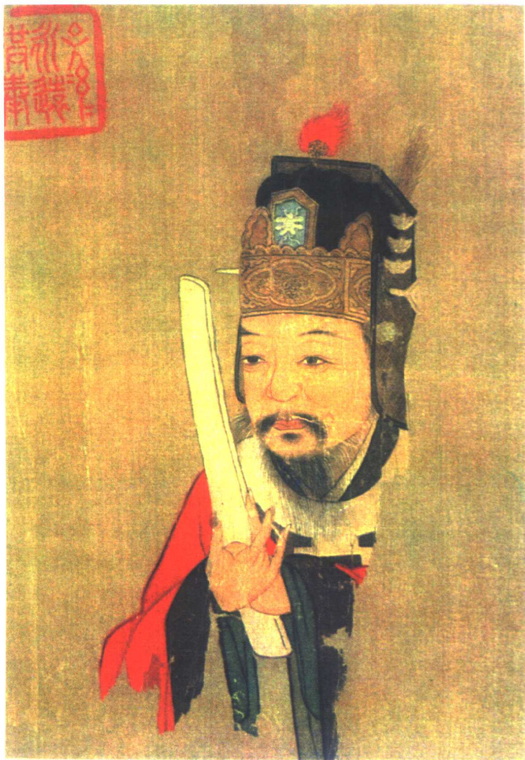
范仲淹像 [明]无款 原件75.4cm × 28.9cm藏南京博物院