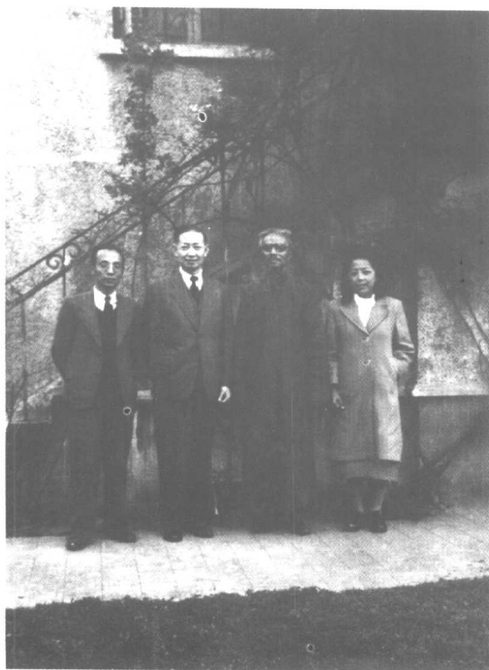
与长女丰陈宝、次女夫婿宋 慕洁在上海梅兰芳寓所与 梅兰芳合影(1948年)。