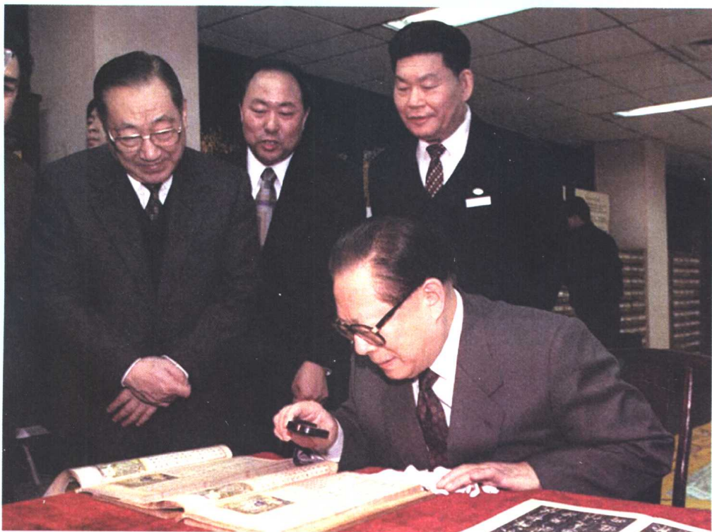
1998年12月22日，江泽民主席视察国家图书馆。