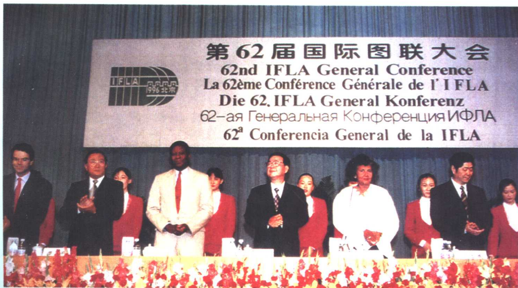
1996年8月26日，国际图联第62届大会开幕式在北京国际会议中心隆重举行。时任国务院总理李鹏出席了大会开幕式。