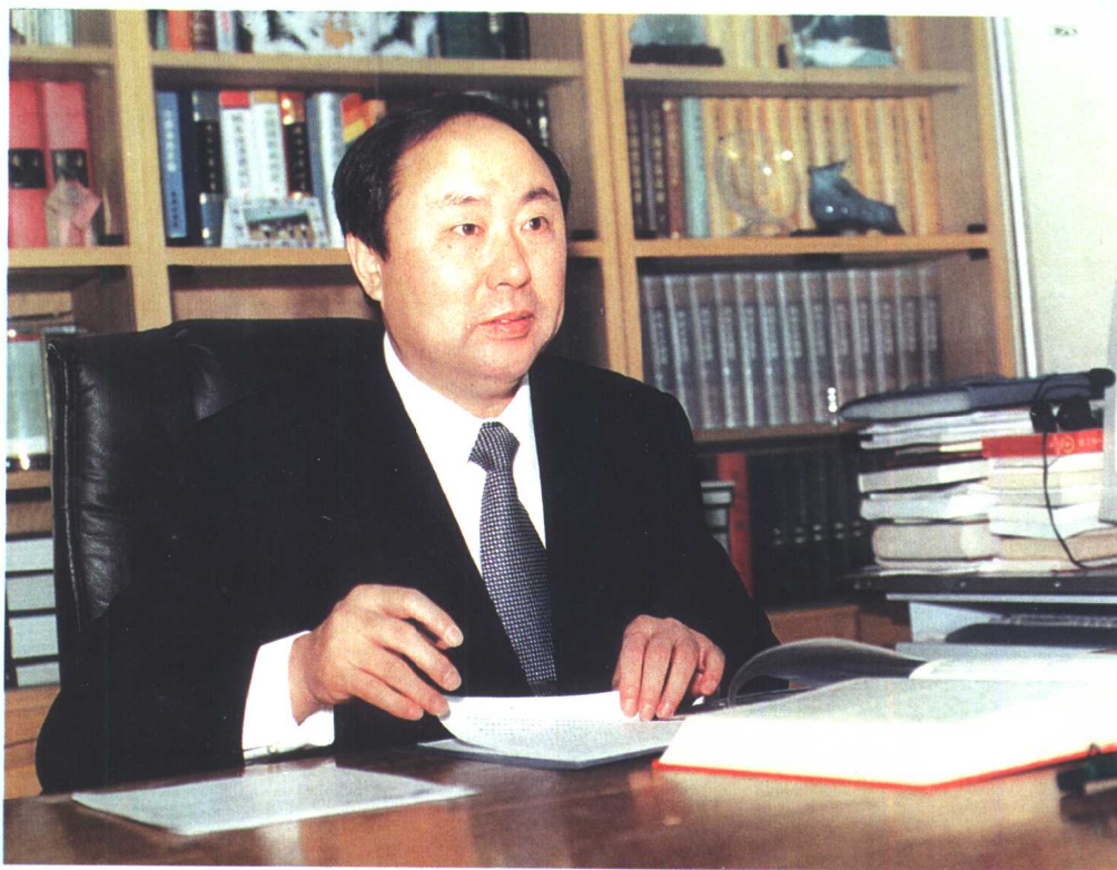
文化部副部长、中国图书馆学会理事长周和平