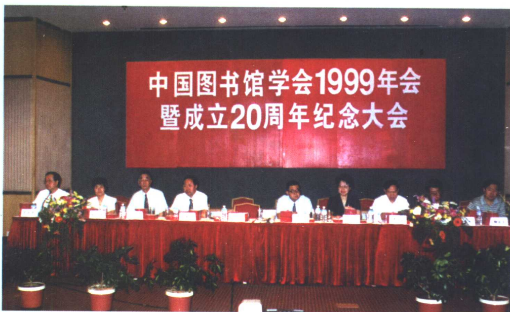
1999年7月9日，中国图书馆学会1999年会暨学会成立20周年纪念活动开幕式在大连星海会展中心隆重举行。