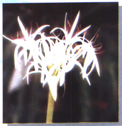
文 殊 兰