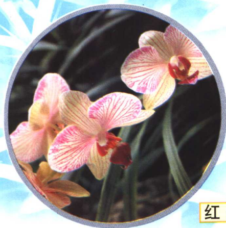
红 莲 瓣