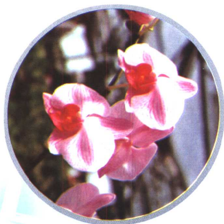
蝴 蝶 兰