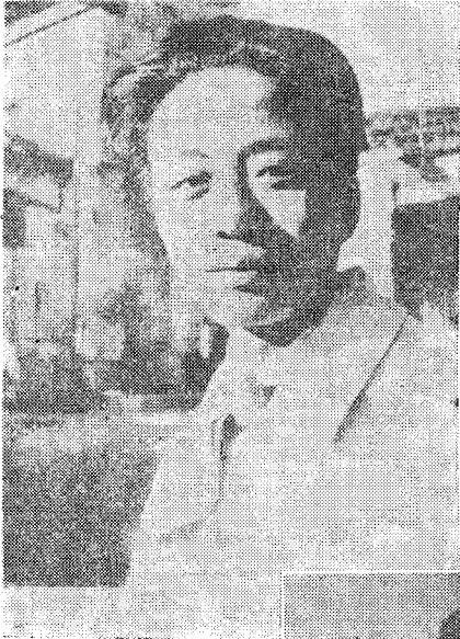
一九二九年在法国巴黎近郊玫瑰村