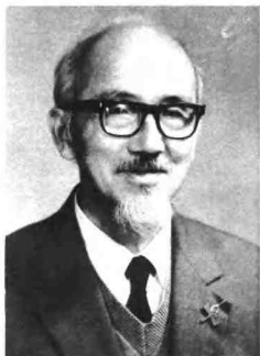
图1 我在科学领域内，并没有作出重大的贡献，但我对祖国、对人民的火热的心，为学术艰苦奋斗的旅程，和半生坎坷的命运，也许体现了我们这一代知识分子的共性和特性。