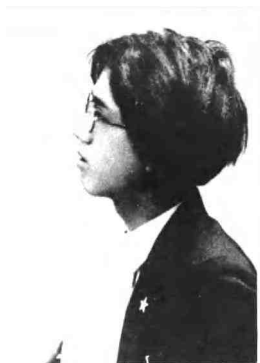
图4 我当时已是个世界语者了…经常佩戴着绿星章…对世界语创始人柴门霍夫的理想，抱着宗教般的热情。