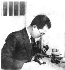
图 10 我分配到一个靠窗的座位，……领来了一架显微镜，一架解剖镜和一副绘图仪……我当天就开始了研究工作。