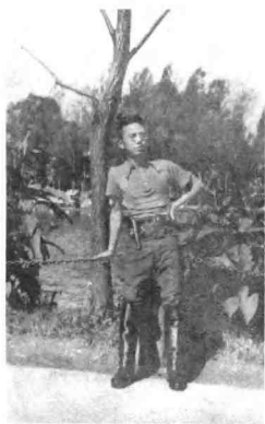
图 12 回到广州的第二天，我就参加广东地方军，穿上了军装。