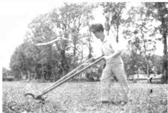
图6 我在一、二年级，结合实验劳动参加了对棉花生长由种到收两个全过程的大田劳动。