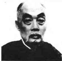
图5 我对这位先校长——张謇先生是怀着无限敬意的，他的实干精神对我产生影响，南通人民传统的爱国精神，也给我留下了深刻的印象。