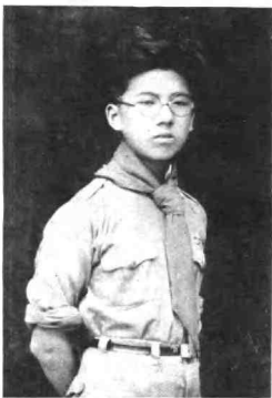
图2 我看到洋人在中国的土地上无法无天，小拳头捏得格格作响，眼睛快冒出忿怒的火光。