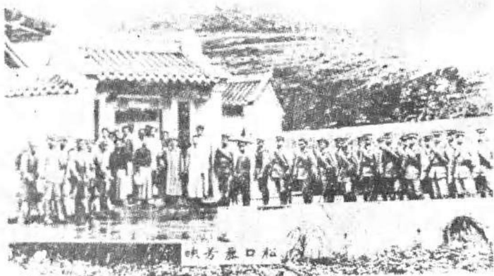
1918年5月孙中山辞职东渡，图为路过梅县松口时的留影。