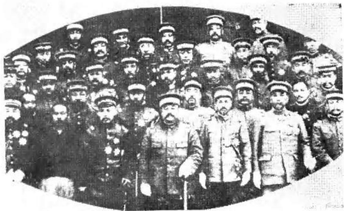
1917年3月入京干政的督军团