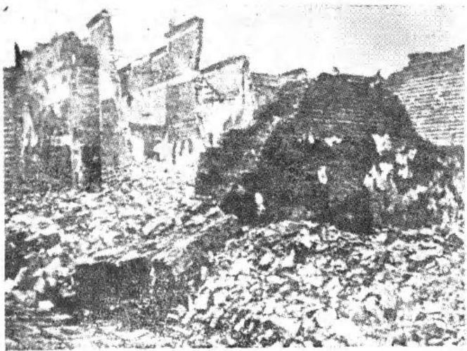
护法战争中遭北洋军炮火破坏的醴陵