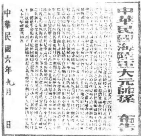
孙中山就任护法军政府大元帅后发布的布告