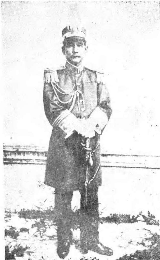
护法军政府大元帅孙中山