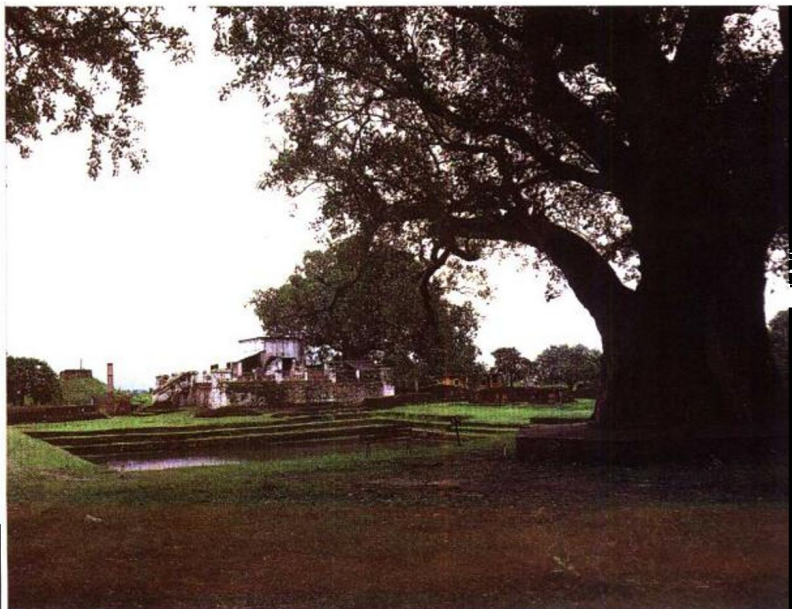
图3 尼泊尔 蓝毗尼园遗址