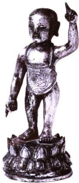
图1 明代金铜释迦太子诞生像 高17.5厘米 美国旧金山亚洲美术馆藏

如果没有诞生释尊(图1),佛像也就不能产生。然而,佛像从其创始期开始,到底在多大程度上更接近释尊的真容呢?莫如说,是在多大程度上被理想化,即佛像在其制作的地方是在多大程度上受到当地风土强烈影响的。顺着佛像的系谱,可以看清其地域及其地域上释尊的理想像和真实姿容之间的差别。在这里,首先从社会环境和人种观点出发,依据史实,尽可能地将释尊的生涯概观如下。