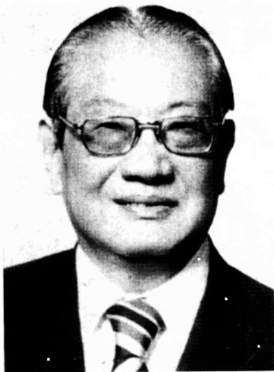
董建華的父親董浩雲