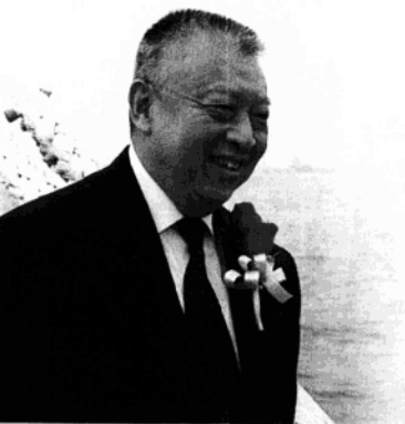
新船下水董建華笑逐顏開