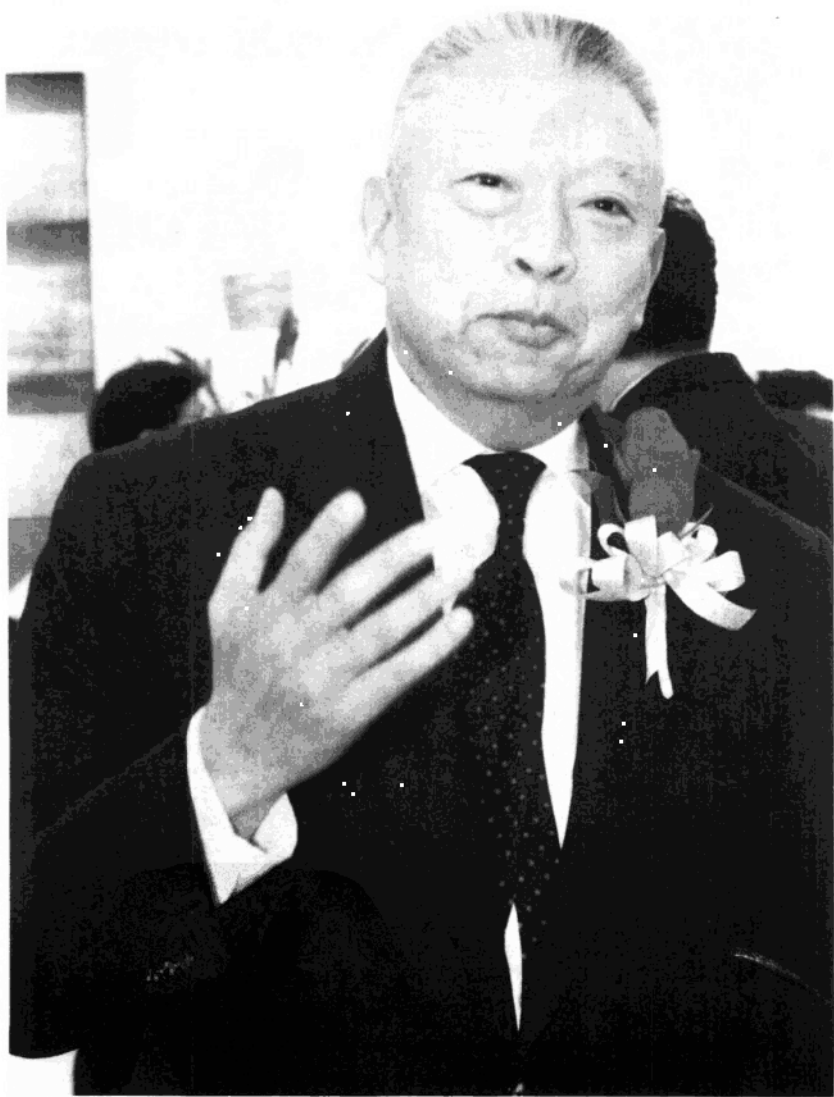
1995年，春風得意的董建華