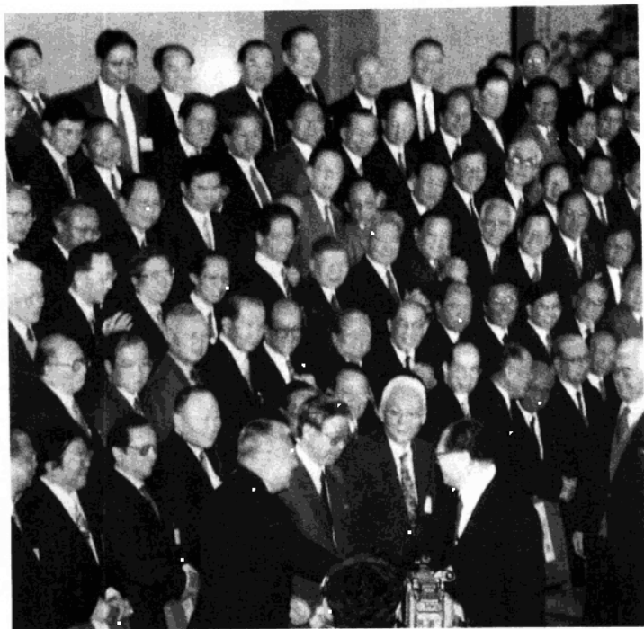
96.1.26江澤民趨前与董建華握手