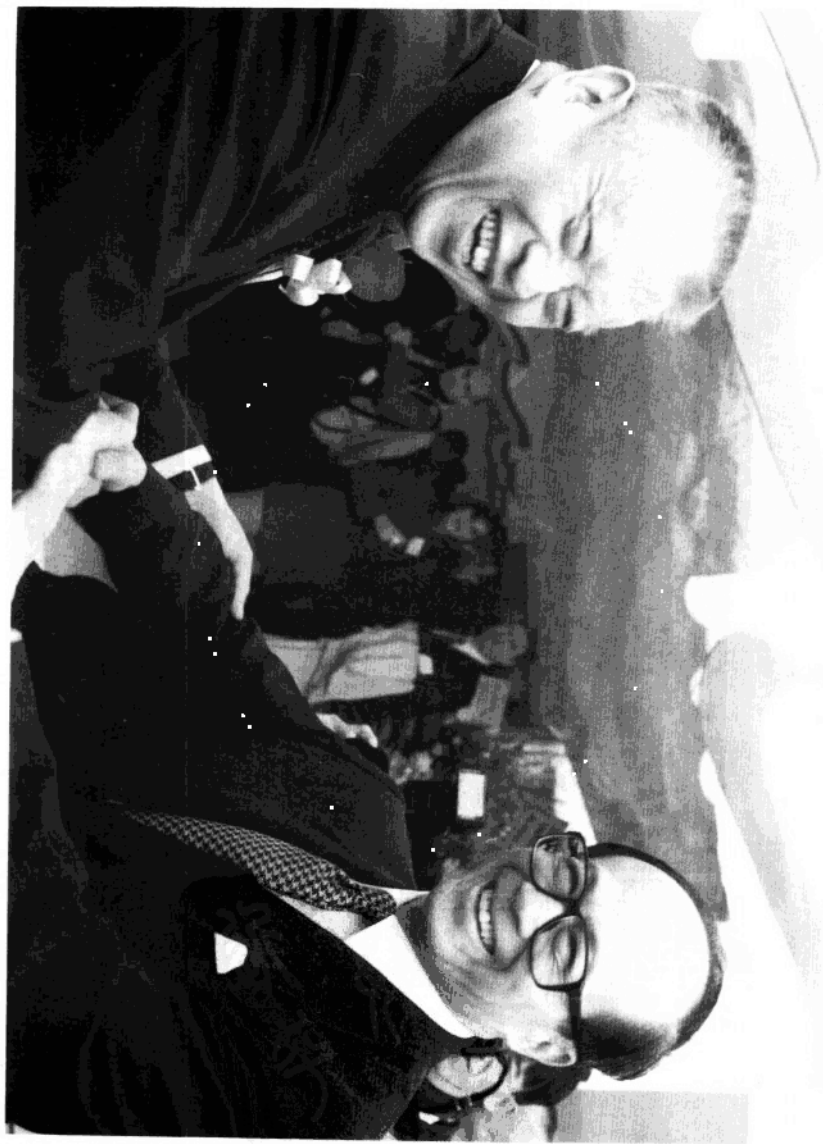
李嘉誠與董建華老友(鬼鬼)