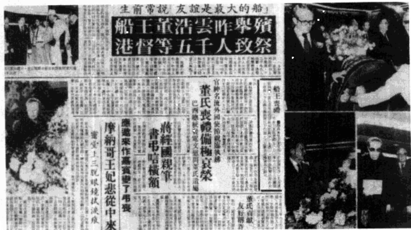
報紙刊登董浩雲舉殯的消息