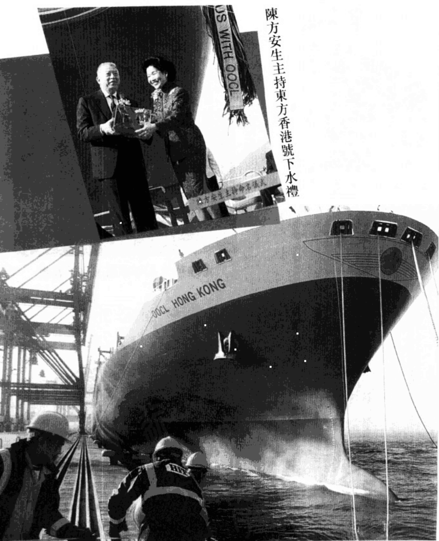
東方海外旗下世界最大的貨柜輪