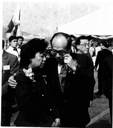
董建華夫人与李嘉誠交談甚歡