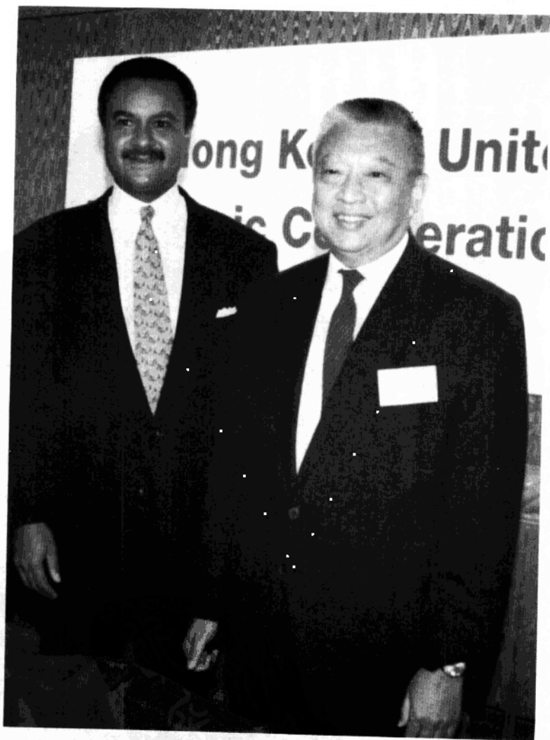
董建華与已故美國商務部長