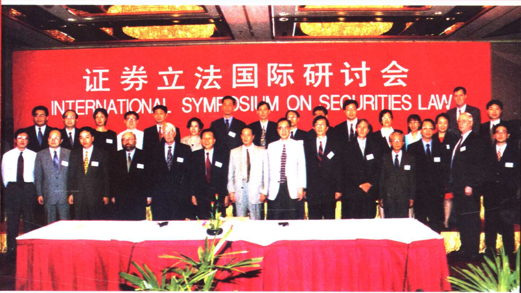
● 1998年9月23日在上海新锦江宾馆召开“证券立法国际研讨会”