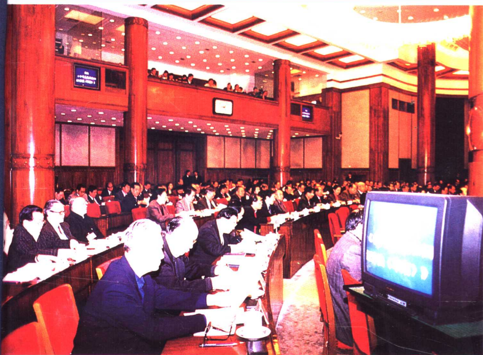
● 1998年12月29日九届全国人大常委会第六次会议通过《证券法》