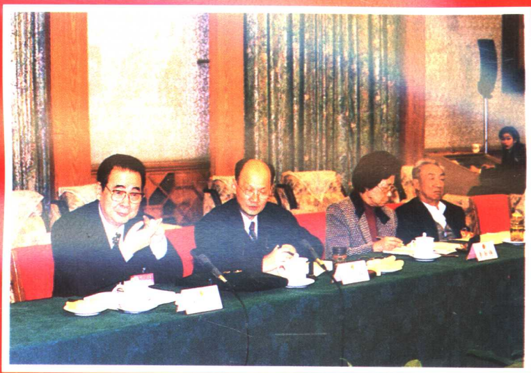
●李鹏委员长和委员们一起审议有关法律文件