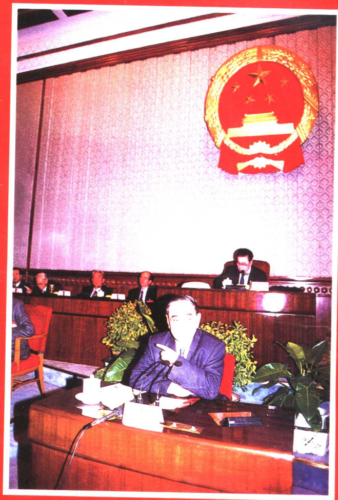
● 1999年12月28日厉以宁委员在九届全国人大常委会第六次会议上，就《证券法》的出台有利于国民经济的健康发展为题发言。