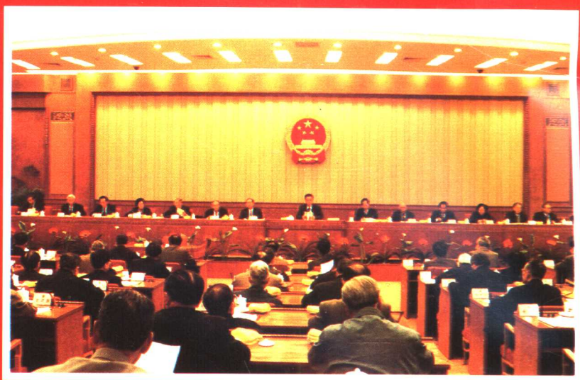
●九届全国人大常委会全体会议审议《证券法》