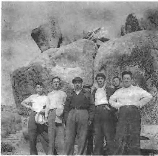
1958年，陪同许世友上将视察。（左二周志坚，左三军区司令员许世友上将）