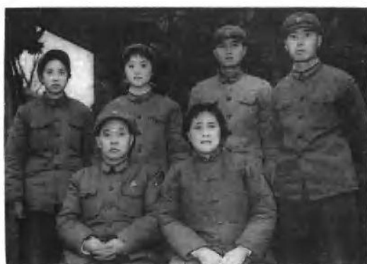
在南京军区工作时，全家合影