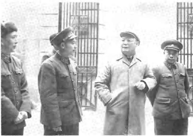
1956年周志坚陪同叶剑英元帅视察部队（左二周志坚）