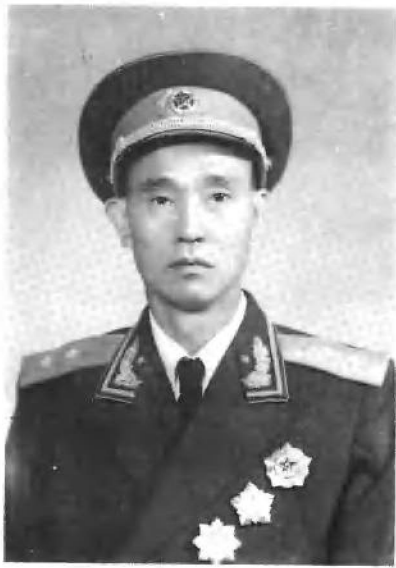
作者 周志坚 (1955年9月)