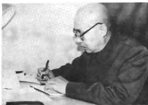
1986年，在南京撰写回忆录