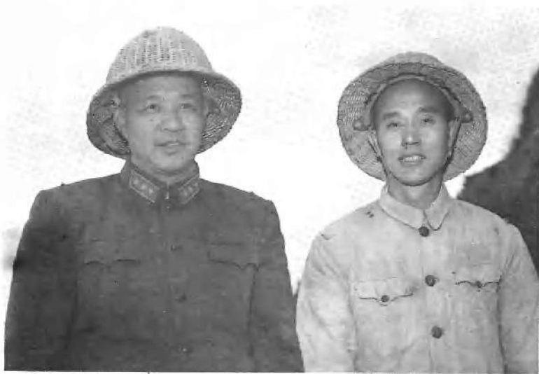
1958年，下连当兵工程作业。（左一兵团司令员王建安上将，左二周志坚）