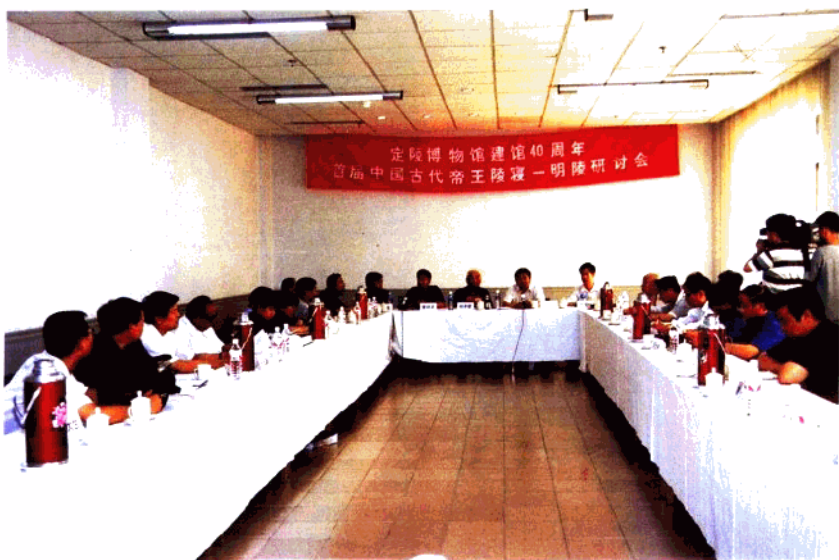
首届明代帝王陵寝研讨会会场