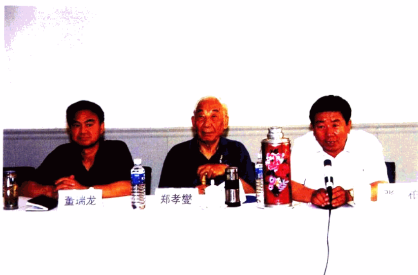
国家文物局副局长张柏出席会议并讲话