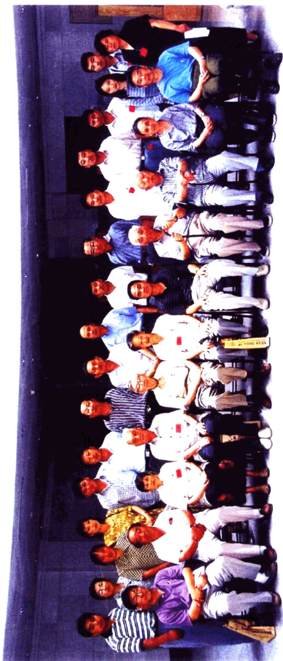
首届居庸关长城文化研讨会与会代表合影