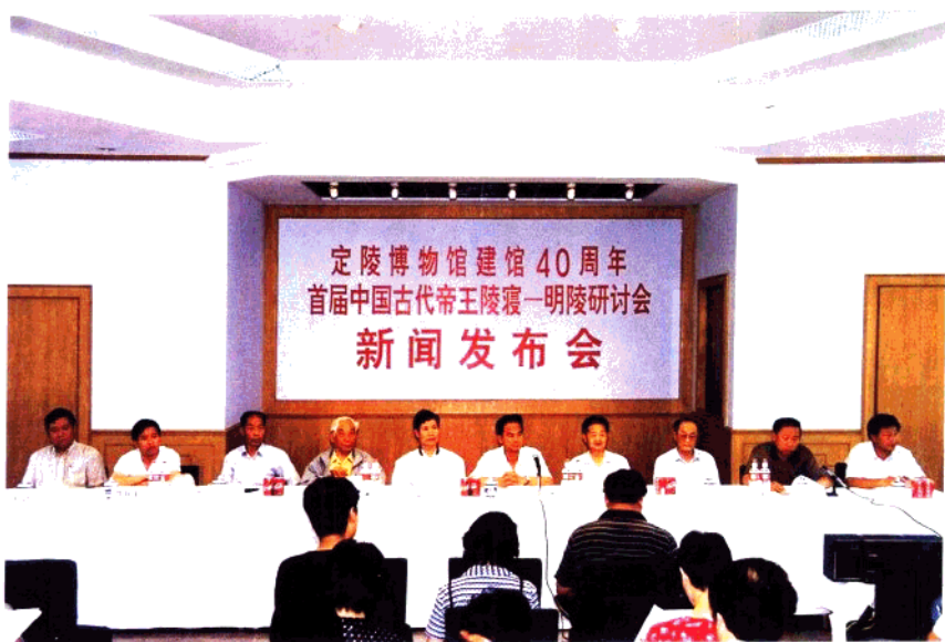
十三陵特区办事处、明十三陵博物馆于1999年6月18日在定陵博物馆 召开新闻发布会