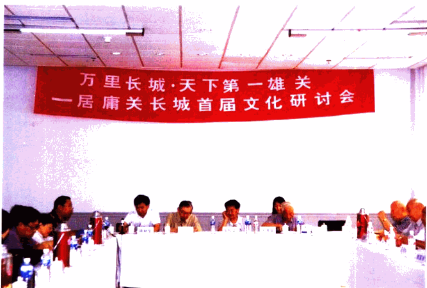
首届居庸关长城文化研讨会会场