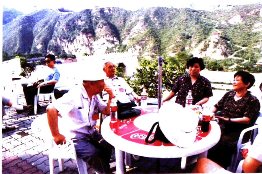
专家学者在居庸关长城考察并小憩