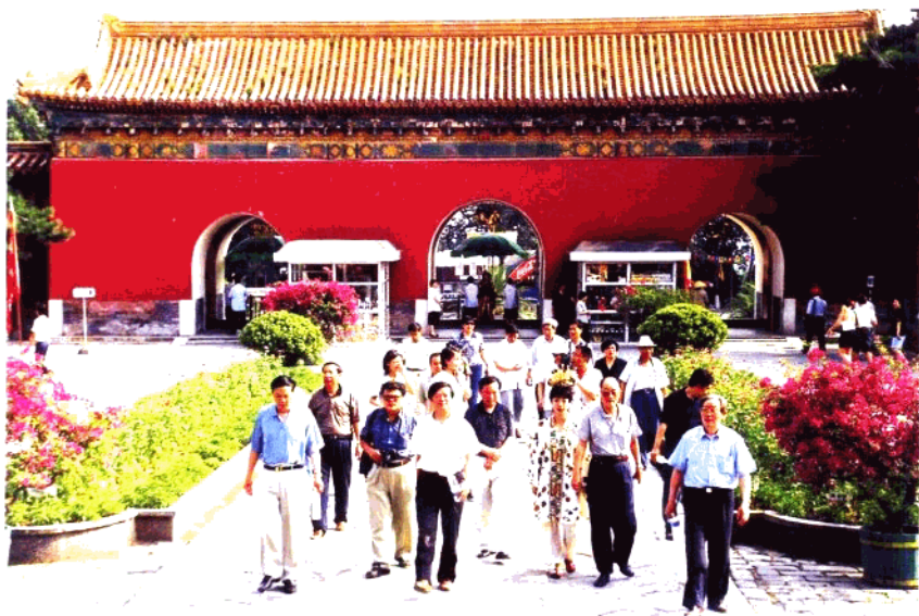
與會專家學者考察明長陵