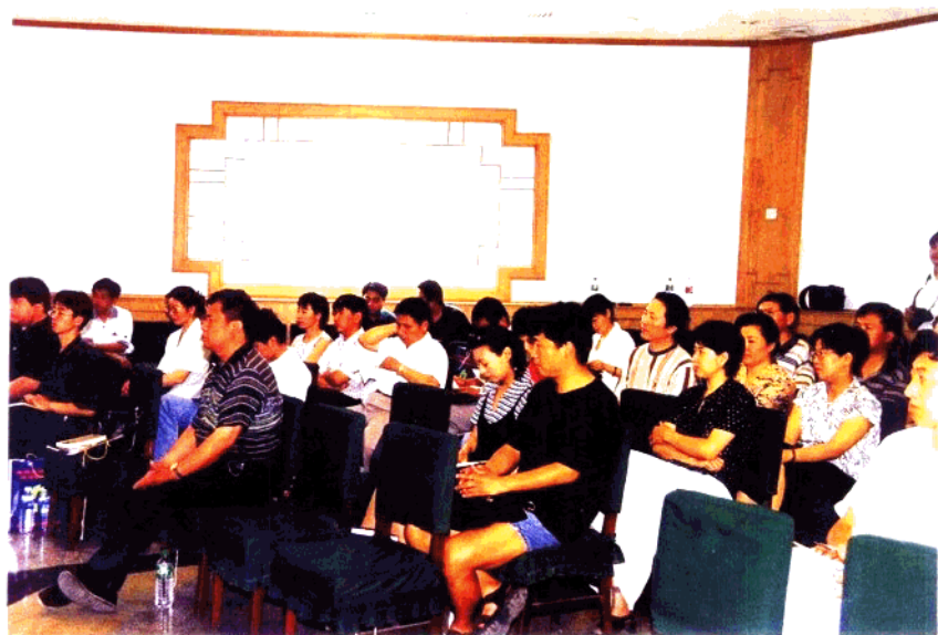
在京 30 余家新闻单位记者出席新闻发布会