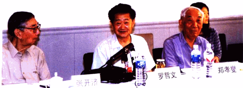
著名专家张开济、郑孝燮、罗哲文出席研讨会并讲话