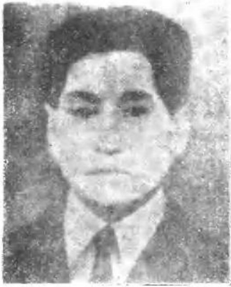
高 风 烈士