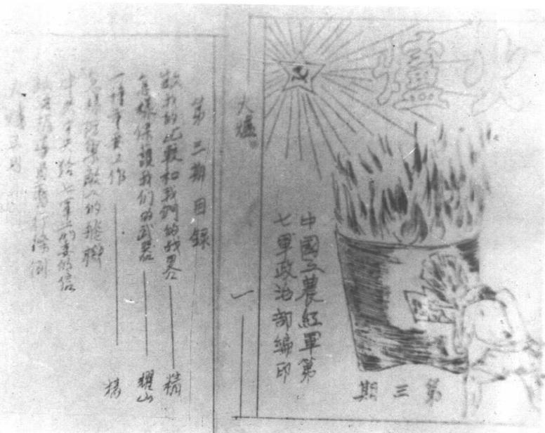
中国工农红军第七军政治部于1931年7月18日在兴国县境内创办军内刊物《火炉》。