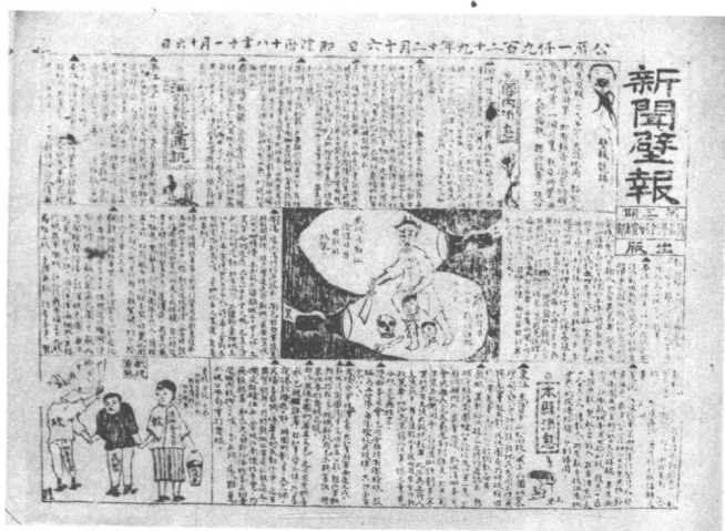
1929年11月湘鄂贛边万载革命委员会宣传部出版《新闻壁报》半月刊。