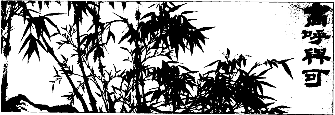
石涛《水墨竹石卷(局部)》