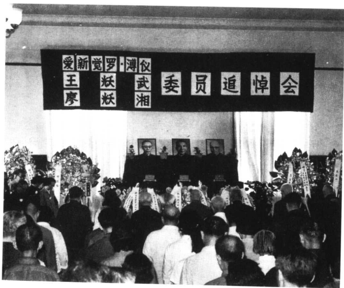
这边说一九四八年殉国；那边二十年后开追悼会