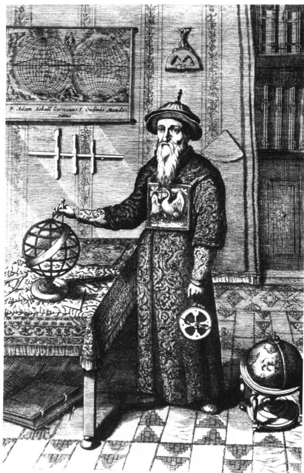
一六七〇年汤若望 (Adam Schall) 在北京