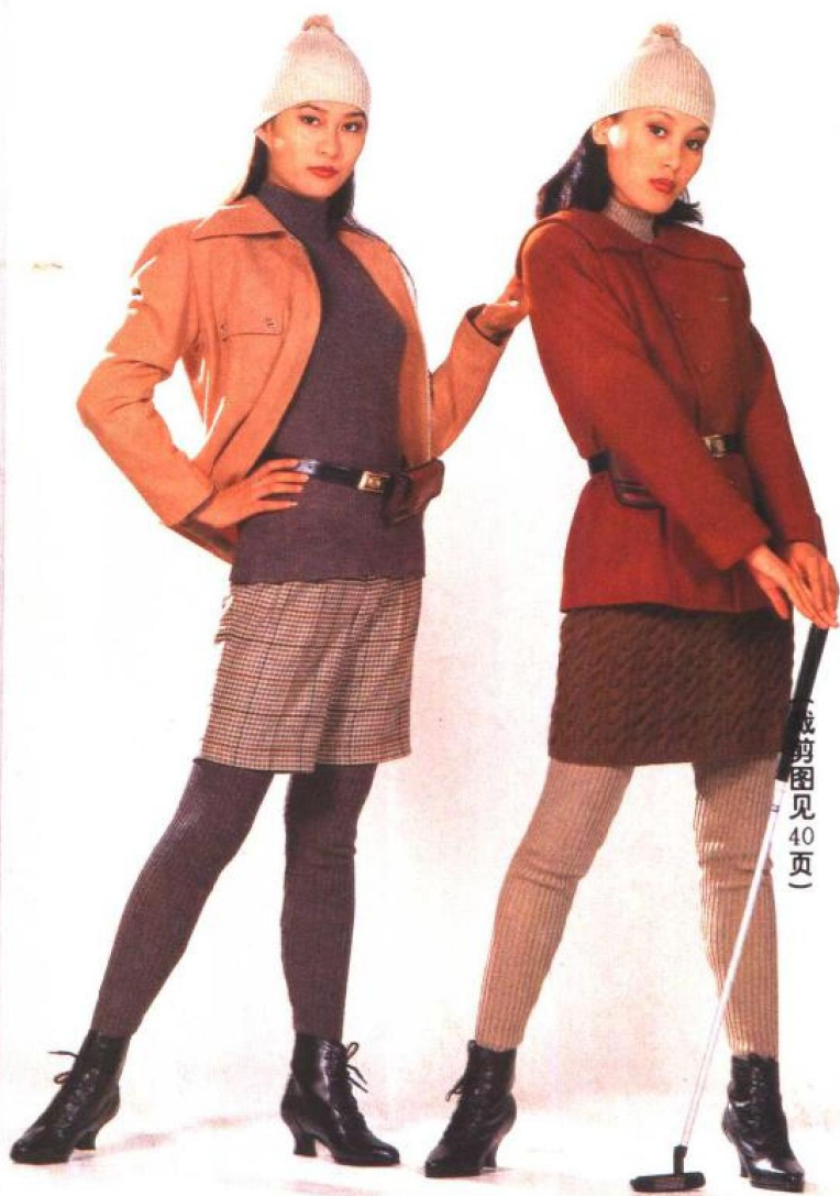
(裁剪图见 40 页)