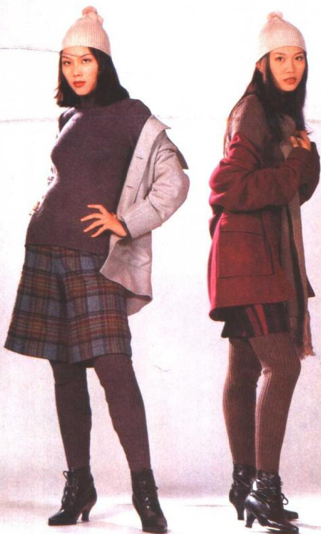
(裁剪图见 39 页)