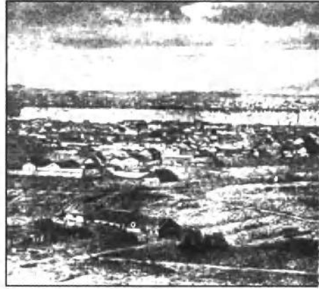
太平天国时代的天京(南京)