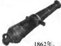
1862年，太平天国苏福省造的铜炮。