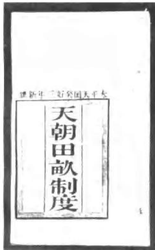
太平天国的革命纲领一《天朝田亩制度》。