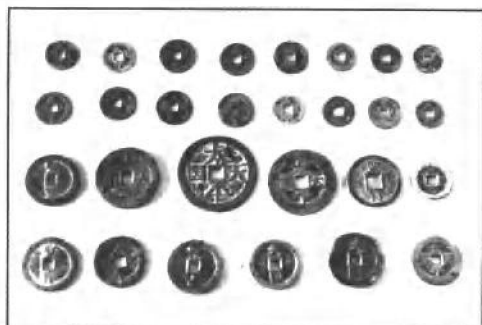
太平天国铸造的各种钱币