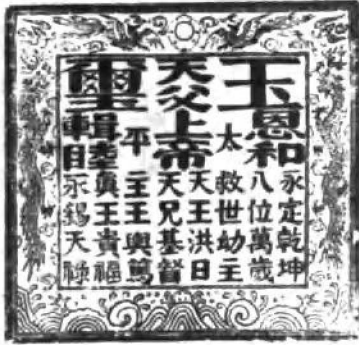
天王洪秀全玉玺。天王玉玺之印文： 太平玉玺 天父上帝 恩和辑睦 天王洪日 天兄基督 救世幼主 主王與笃 八位万岁 真王贵福 永定乾坤 永锡天祿