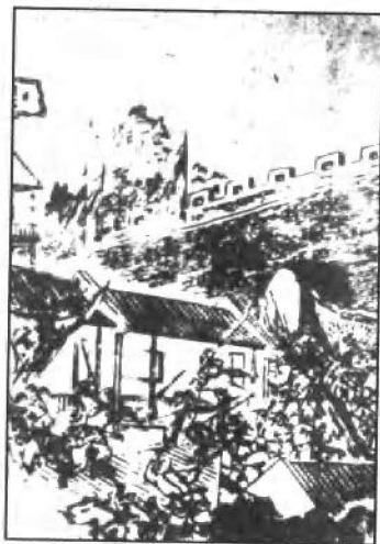
太平軍攻克永安圖