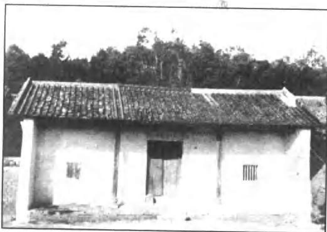
1843年，洪秀全、馮云山創建了“拜上帝會”。洪秀全打毀了村塾中的孔子牌位，向封建制度宣戰。這是他打毀孔子牌位的地方——花縣蓮花塘村塾遺址。