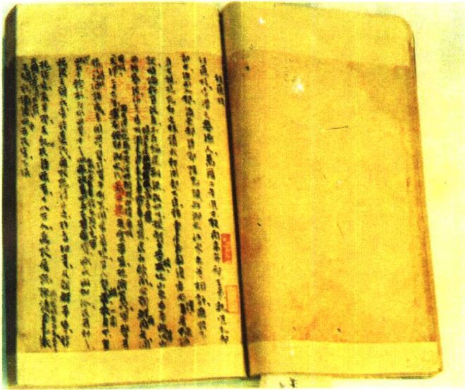
宁波天一阁藏万斯同《明史稿》原件照片