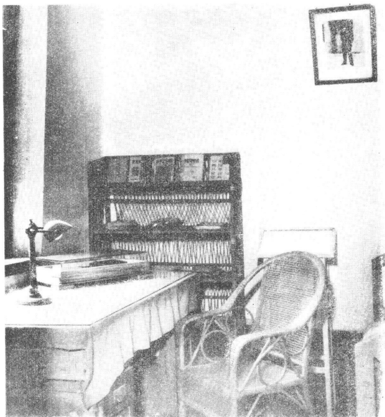
པ་ལུ་ཅུན་གྱི་ཨན་དོན་གཙོད་ཁང་ནང་གི་སྐོ་མཉུན་གྲོུ་ཨན་ལའེ་ཨི་གཟམ་ཁང་།