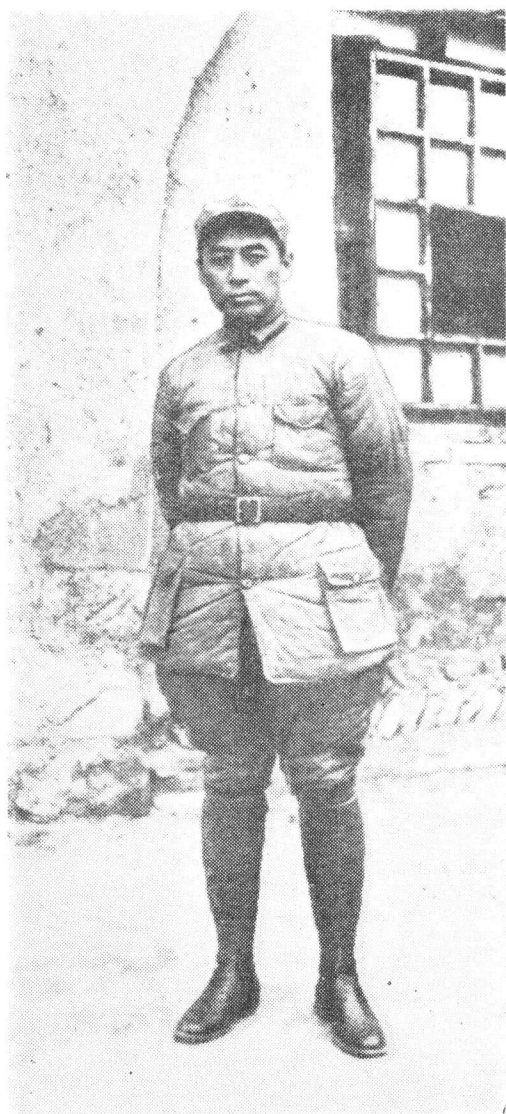
ཞི་ཨན་ཏུམ་འགྲུར་ཕྱིང་རྗེས་ཀྱི་ལོ་ 1937 ལོའི་ལོ་ལྟར་སློབ་མཁུན་ལྟེན་ལོ་ ཨན་ལའི་ཨན་ཨན་ཏུ་བརྒྱུགས་ཡོད་པ།