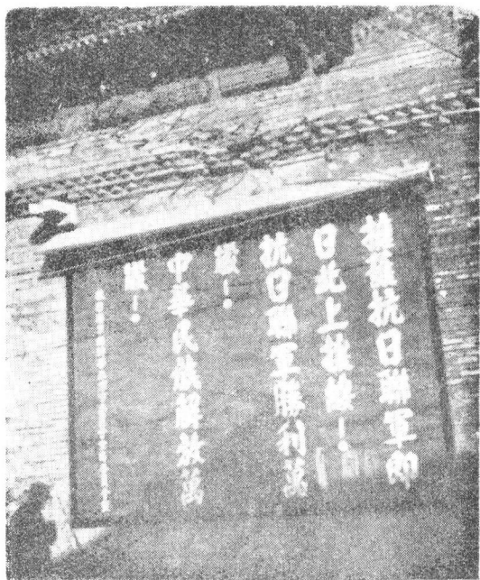
འདྲི་ནི་རྣམས་དྲུག་ཞི་ལན་གི་ཐུབ་ཚུལ་ གོག་ཁབ་གི་ཅིག་ལྟམས་སུ་བཀལ་བའི་ཐུར་ ཡིག་གི་བྱང་ཡིན། ཐུར་ཡིག་འབྲི་མཁན་ ཞི་རི་འཕྲིག་མཉམ་འབྲེལ་དམག་གནས་... སྐབས་ཐུབ་ཐུབ་དམག་དོན་ལུ་ཡོན་ལྷན་... ཁབ་གི་ཤིལ་བཟུགས་ལུ་ཡོན་ལྷན་ཁབ་ཡིན་ ཞེས་བཤད་ཡོད།