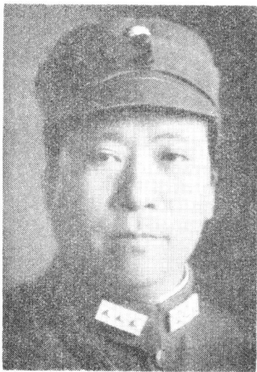
ཞི་ཨན་ཏུམ་ལུལ་སྐབས་ གི་ཅང་ཚུན་དབང་ཏུ་ལོང་།