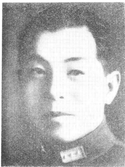
ཞི་ཨན་ཏུམ་ལུལ་སྐབས་གི་ ཅང་ཚུན་ཡང་ཉེ་ལོ་ལོང་།