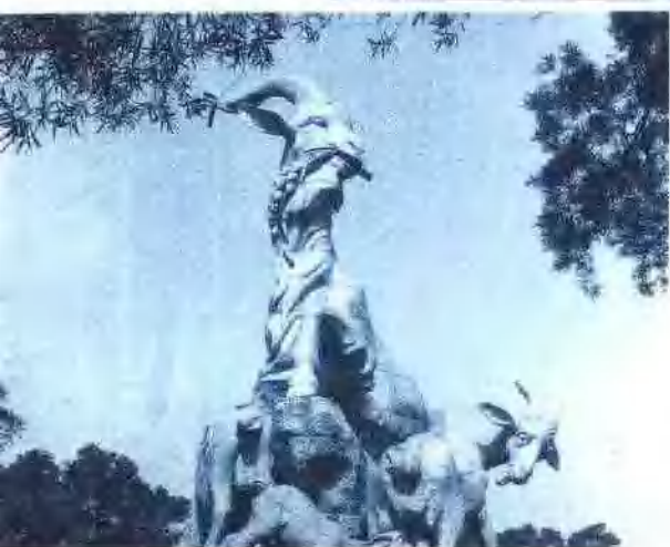
越秀山上的五羊塑像