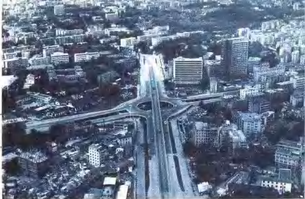
新建的区庄立体交叉桥