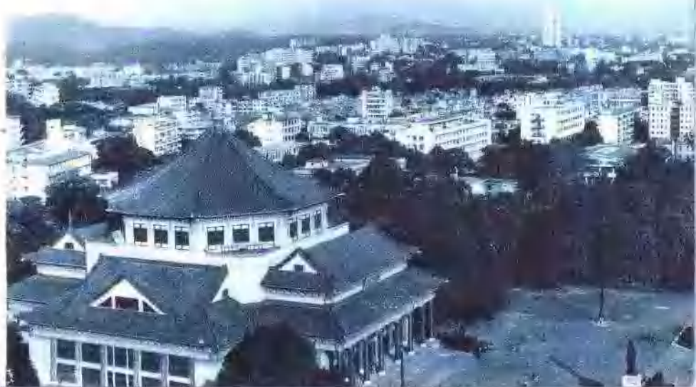
广州中山纪念堂前新楼处处