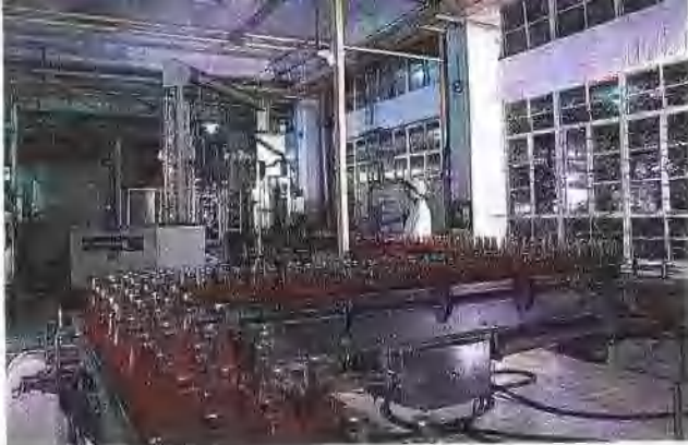
亚洲汽水厂引进的两条汽水生产线