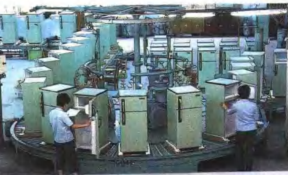
广州冰箱厂引进的日立电冰箱装配生产线