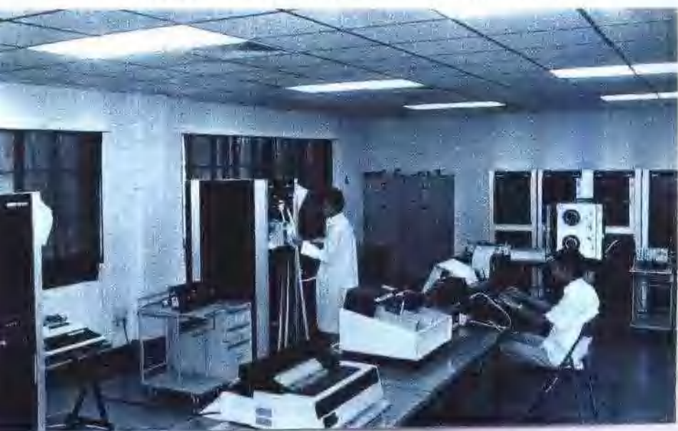
广州计算机厂从法国引进的我国第一台小型计算机生产线