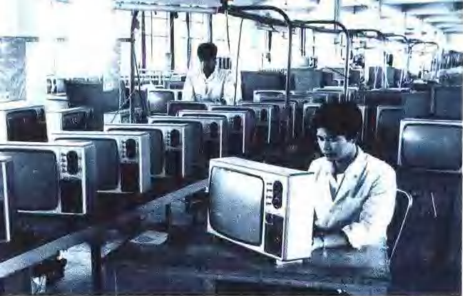
广州广播器材厂新建的电视机装配线