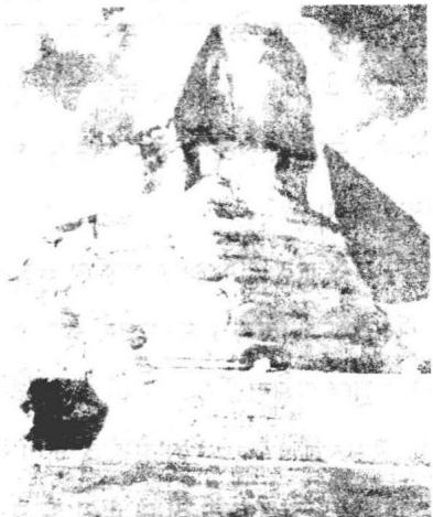
༡ རིང་ལུགས་ ཤིང་བཞོས་ཆེན་ཆེན་གྱི་སྐུ།

བལྟས་ན། ང་ཚོས་དངོས་ཡོད་རིང་ལུགས་རིགས་ཤིག་ཤིང་བཞོས་ ལས་མཐའ་གཅིག་ཏུ་མཚོང་ཐུབ།