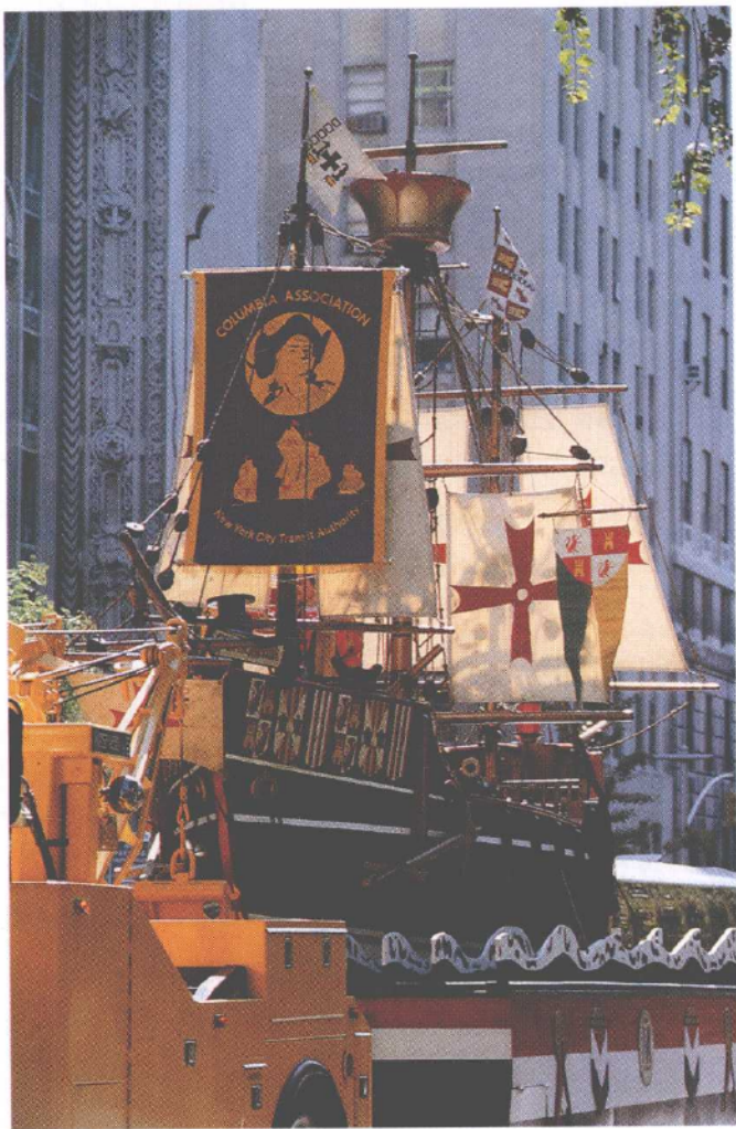
A Columbus Day float in New York.

Americans enjoy remembering the great navigator!