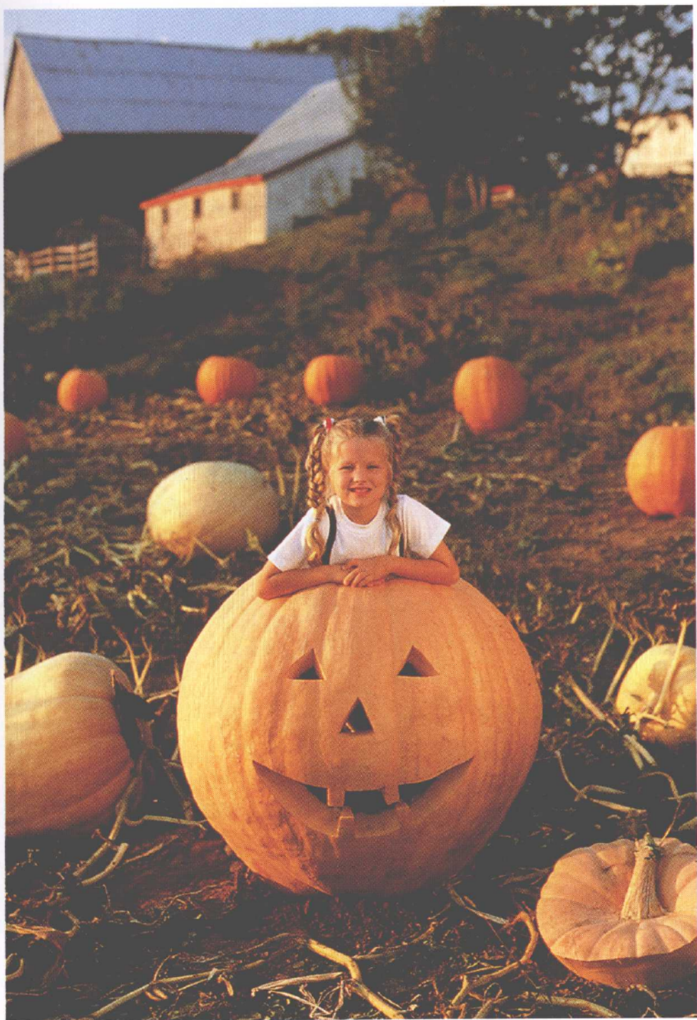
An original way to use an enormous pumpkin!