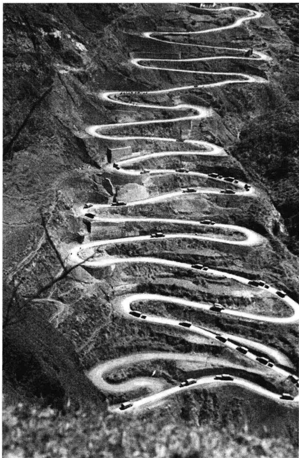
贵州24拐。几乎所有经过滇缅公路的作战物资，都要从这里运往抗日最前线

公路上，行驶的全是满载着美国援华物资的大卡车，这些车辆包括了雪弗兰、福特、道奇、大国际等美国名牌汽车。如今，这条道路上已经很少有车辆经过了，那些只能在照片上看到的美国卡车也早已失去了踪迹。昔景今况，人事皆非，令人歔歔。