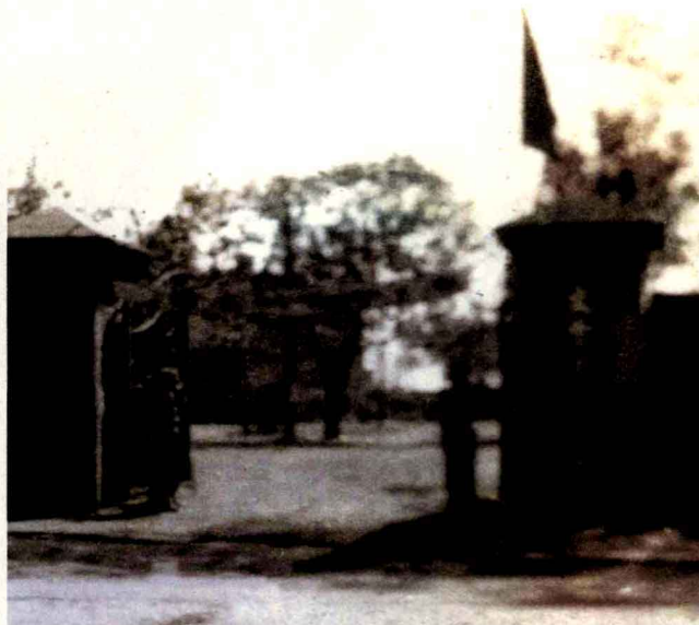
学校的前身——沈 阳文会中学校门

任何故事都有一个起点。需要特别指出的是，青岛科技大学的故事起点，并非自青岛起步。若要全景展开青岛科技大学这幅悠悠长卷，则须上溯60年，到东北热土上的那座“东方鲁尔”之城——沈阳，去溯本寻源。