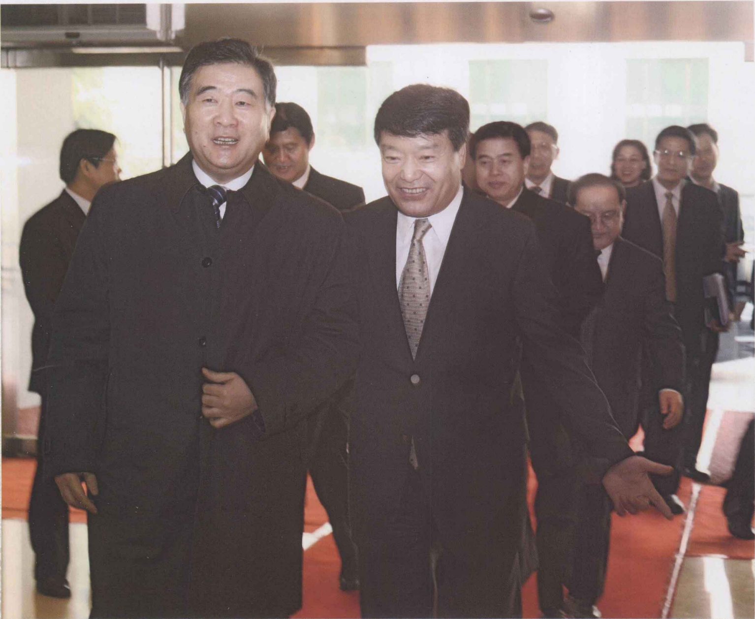
2010年3月11日，在北京出席全国人大会议的中共中央政治局委员、广东省委书记汪洋，广东省委副书记、省长黄华华带队到国土资源部，与国土资源部部长、国家土地总督察徐绍史等部领导共商推进广东节约集约用地试点示范省建设工作。