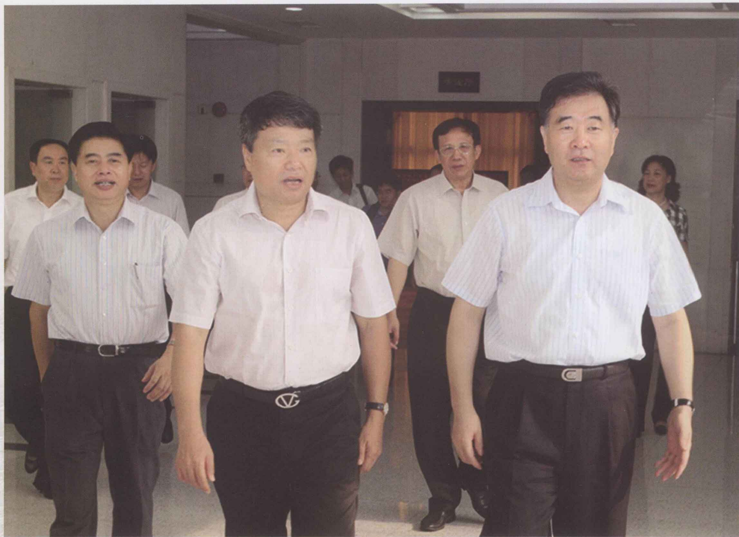
2010年9月6日，中共中央政治局委员、广东省委书记汪洋在广州会见前来广东调研考察的国土资源部部长、国家土地总督察徐绍史一行。