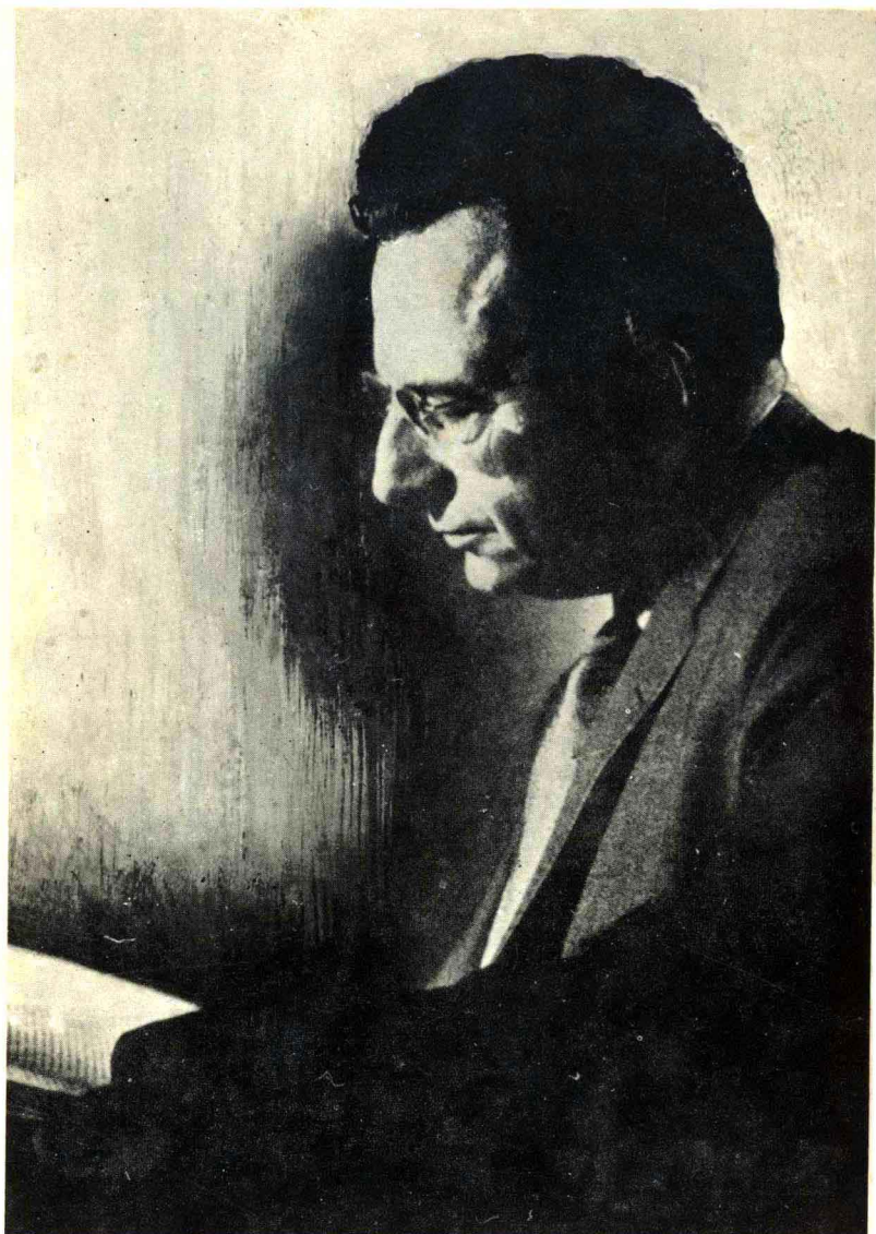
當代心裡分析學家：佛洛姆(Erich Fromm, 1900～ )。