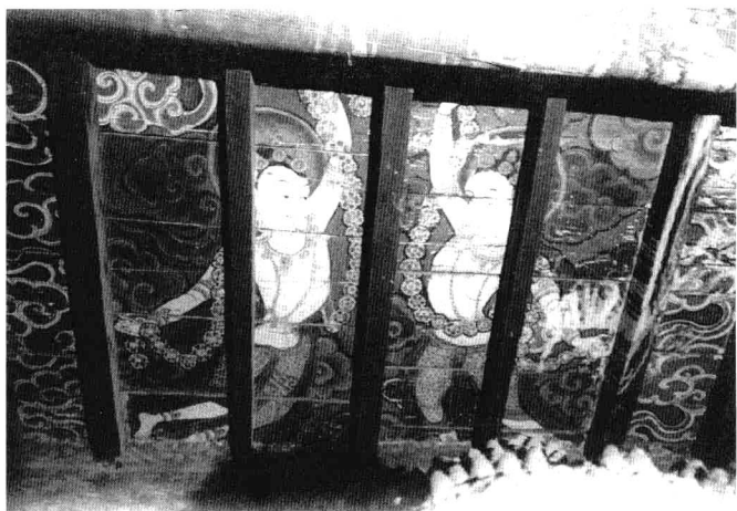
陀林寺白殿天花上壁畫飛天

毗沙門天圖四周，畫有兩行邊飾，其中多畫武士、龍女等。武士身穿甲冑，或騎馬揚劍，或屈膝持刀，或相撲打鬥，勇猛壯健之態，躍然於壁。內部一周，多畫持劍的武士，或坐或蹲，作各種動態；下面一列則或大頭小身，或獸頭人身，或騎馬奔馳，或倒立馬上，或一人