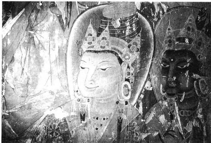
扎塘寺代宋代壁畫菩薩

而死，後期工程，由其侄郡協和郡楚二人於癸酉（公元一〇九三年）以前的三年中全部完成，該寺營建歷時十三年。