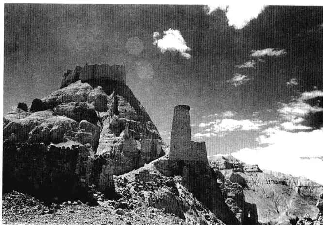
札達縣多香莫爾多古堡遺址

現了在宮內沃德王與阿底峽及其隨從歡聚一堂，興高采烈的場面。人物的描繪是寫實的，雖然技法顯得拘謹，但是很富有質樸的鄉土氣息，是珍貴的古格風俗畫。畫面人物的不同裝束服飾，對於考察當時的歷史與風習，頗有價值。