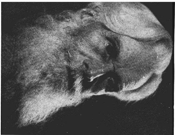
性學大師艾里斯 (Havelock Ellis)