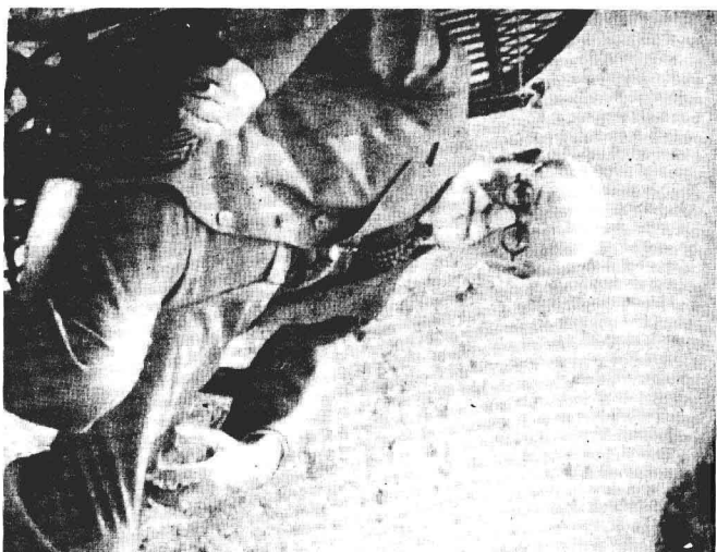
精神分析學大師佛洛伊德 (S. Freud, 1855-1939)