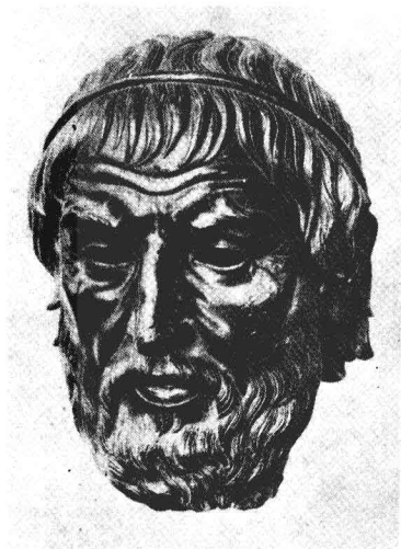
索福克 (Sophocles) 希臘三大悲劇作家之一，「伊底帕斯王」一劇的作者。