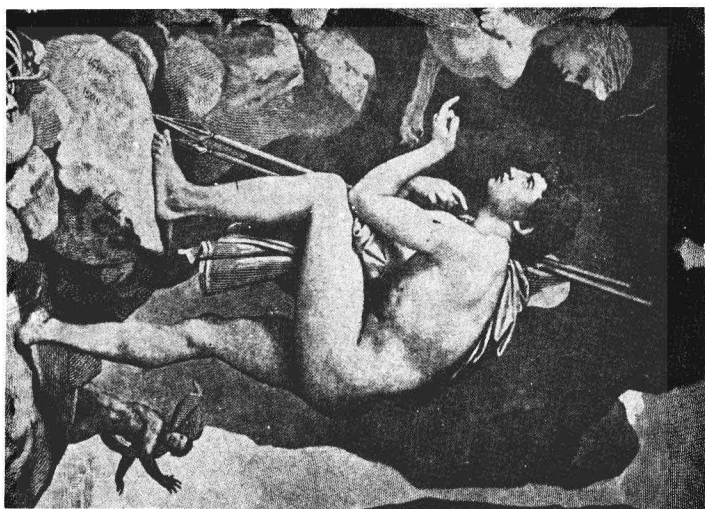
伊底帕斯 (Oedipus) 與獅身人面獸 (Sphinx) 鬥智。伊底帕斯複雜 (Oedipus Complex) 乃弗氏性學理論之重心，而弗氏每以報復獅身人面獸之謎 (the riddle of Sphinx) 為案