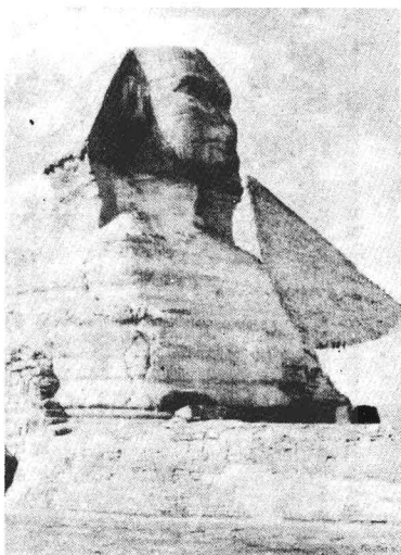
位在埃及大金字塔旁的大人面獅身獸