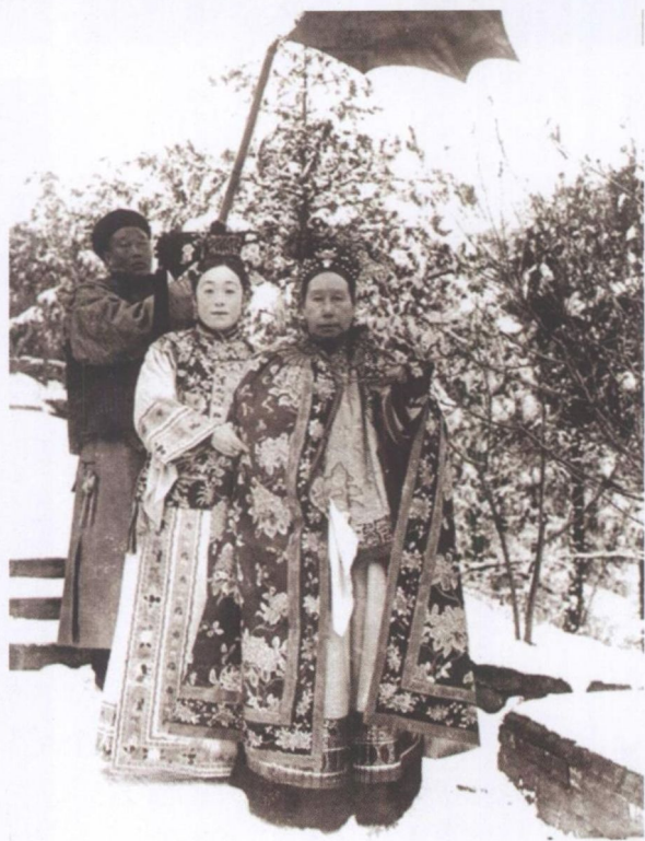
随侍于老佛爷左右