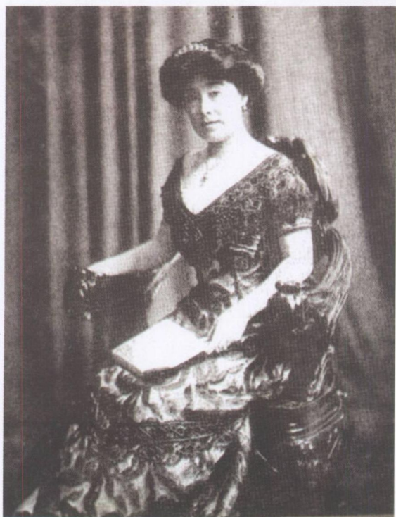
穿着西式长裙的德龄