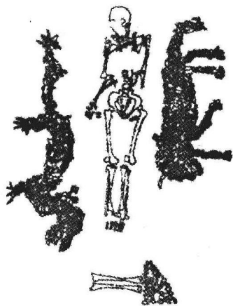
图 1 河南濮阳蚌壳摆塑龙虎和北斗

龙是观念意识物化的神灵造型，它腾云驾雾，兴云布雨，翻江倒海，千姿百态。龙的图形虚拟组合集飞禽走兽、水族及自然天象之精华于一身。参与虚拟组合的爬行动物有鳄、蛇、蜥蜴；哺乳动物有马、牛、猪、狗；水生动物有鱼；自然天象有闪电、云雾、海潮、龙卷风、泥石流。龙的造型起源目前有证据的是新石器时代，距今约 6400 年。在濮阳出土的龙虎蚌塑图案(图 1)更加可以确认龙的形象之古老，那条龙的形状与现在流行的差不多。该图案可以证明 6000 年前人们已经想象了一种如此这般的龙。还有红山文化出土的“C”字形白玉龙(红山文化最典型的玉器品种，被誉为“天下第一龙”)，以及新疆出土的唐代绢画夏娃和伏羲人头蛇身缠绕像(图 2)，都表明龙不仅被参与组合图腾的民族所接受，而且还被整个中华民族所接受，已成为中华民族共有的图腾。