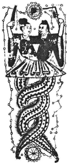
图2 新疆吐鲁番出土 唐代绢画

这些伟大的民族精神构成我们中华玉文化的凤骨，是我们取之不尽、用之不竭的宝库，是我们中华民族新世纪立足世界民族之林的制胜法宝。中国的玉文化延续时间之长、内容之丰富、范围之广泛、影响之深远，是世界上其他文化难以比拟的，其成就和辉煌不亚于伟大的万里长城和秦始皇兵马俑的奇迹。作为艺术，它是永恒的，将与地球同在，与日月同辉。