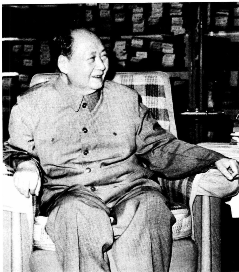
毛泽东在中南海游泳池。