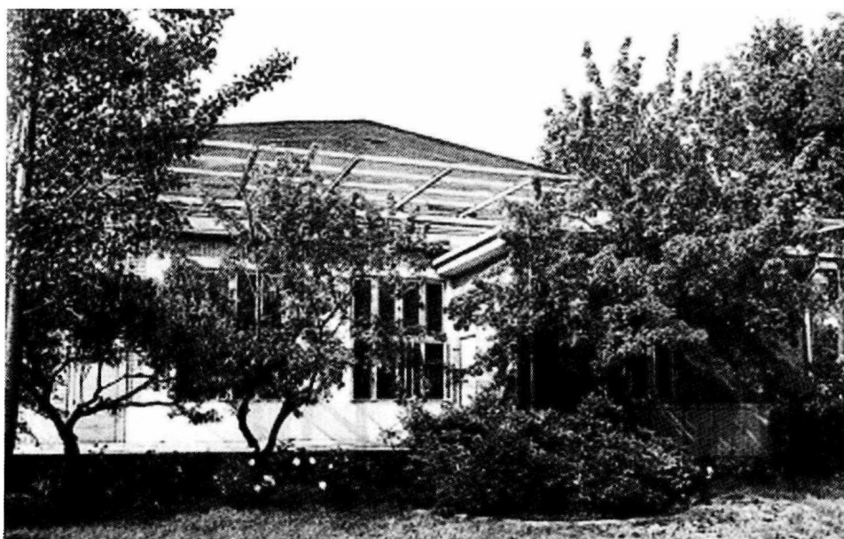
中南海游泳池外景。1966年8月至1976年9月 毛泽东在这里办公、居住。