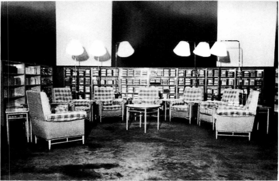
毛泽东在中南海的书房及会客厅。