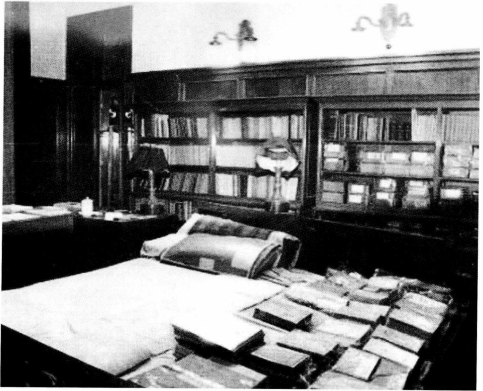
毛泽东在中南海的卧室。