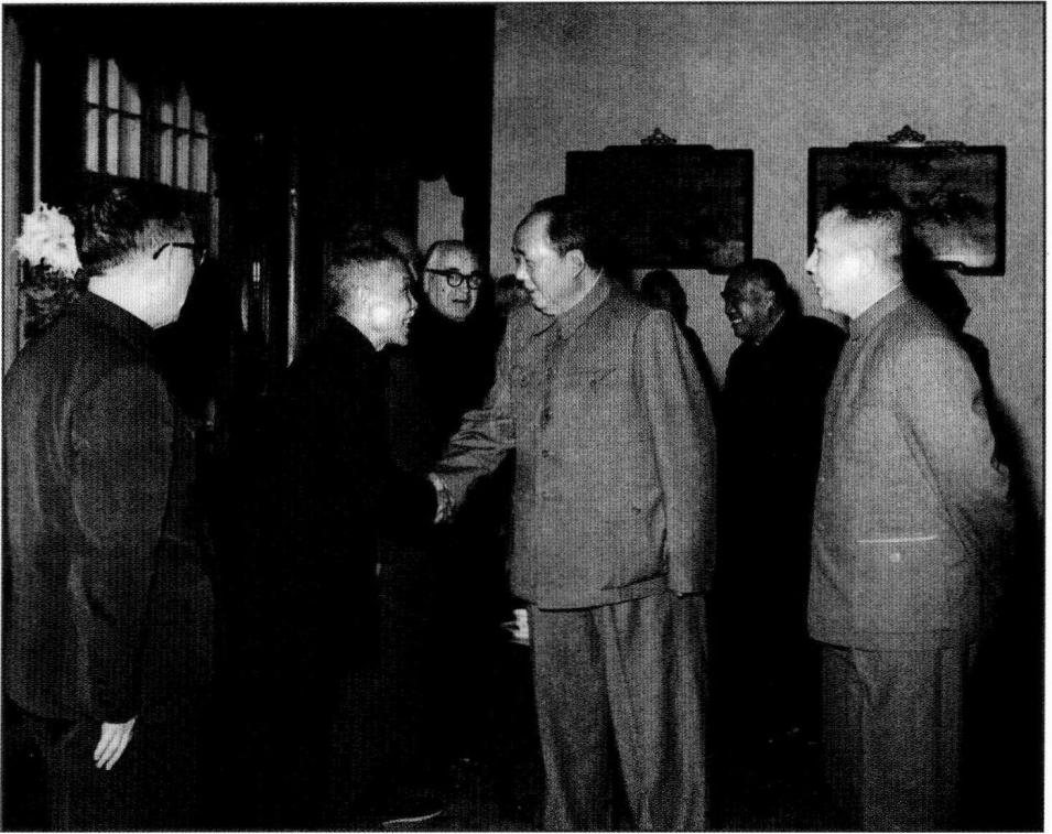
毛泽东会见历史学家翦伯赞（1963年11月）。