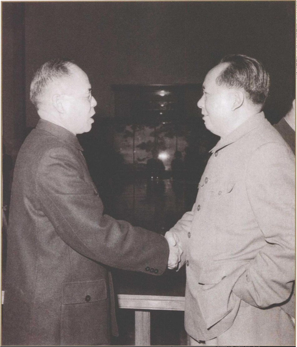
毛泽东会见历史学家周谷城（1960年4月）。