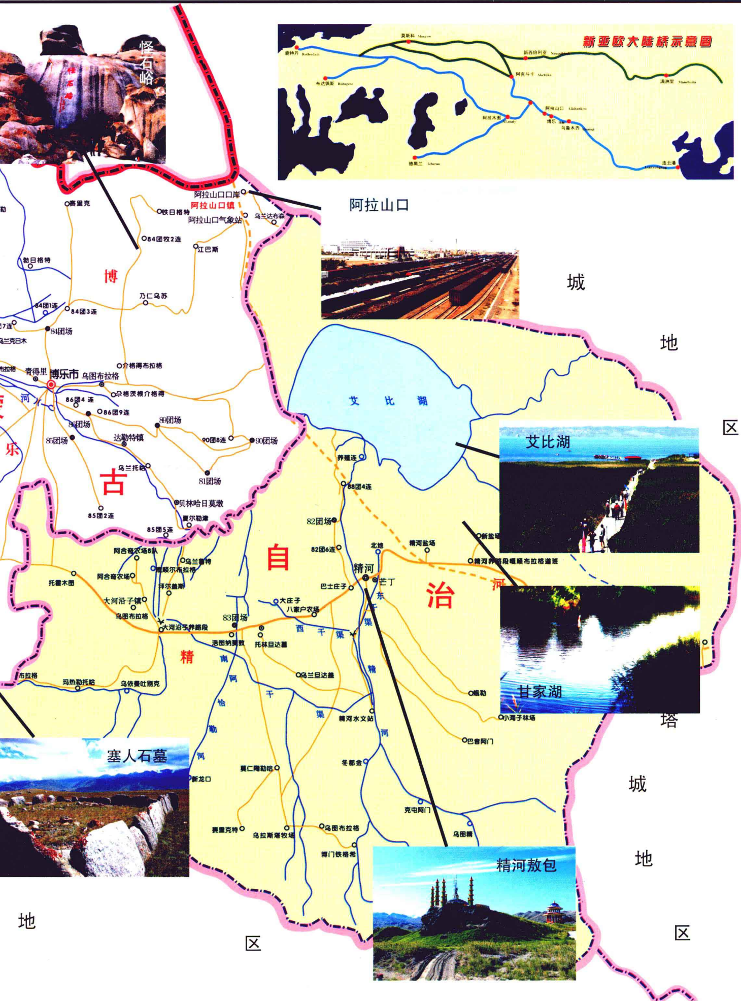
新亚欧大陆桥示意图