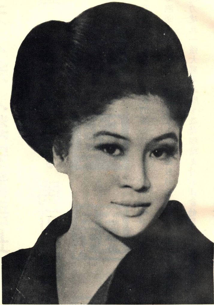
長部置安類人兼人夫一第 照玉斯可馬、斯禮慕羅、黛美伊