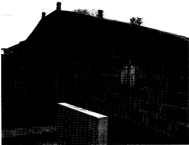
◎ 见证青阳镇历史的明朝古桥

据宣统三年(1911年)版的《江阴县续志》记载,宣统三年(1911年,这一年李旭旦出生)编查户口时青阳镇(即今青阳镇)有三千六百三十八户,九千九百六十三口。当时江阴县最繁华的华墅镇在宣统三年有四千五百九十户,人口二万七千七百零七口。江阴华墅镇“列肆繁盛,百货皆备”;青阳镇“市廛繁密” ① 。可见,青阳镇(青阳镇)在当时的江阴县算得上一个人口规模中等、交通便利、商业繁华、经济比较发达的小镇。