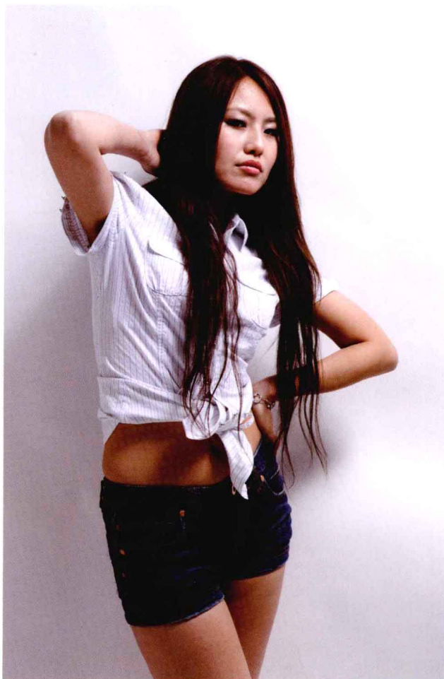
● 光圈：f/8 ● 快门速度：1/125s ISO 感光度：ISO100 ■ 焦距：60mm