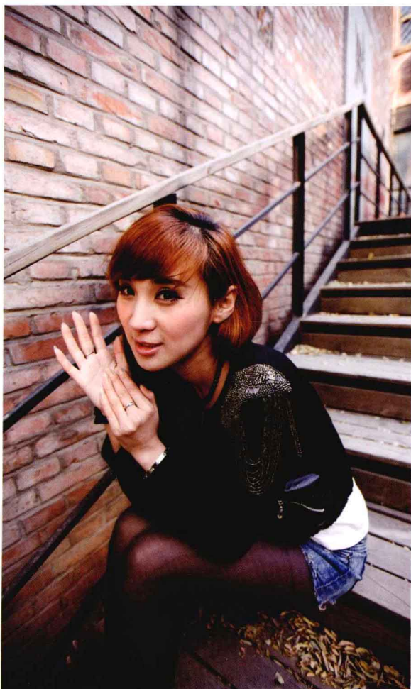
● 光圈: f/9 ● 快门速度: 1/80s ISO 感光度: ISO100 ■ 焦距: 24mm