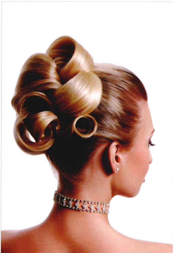
● 光圈：f/8 ● 快门速度：1/200s ISO 感光度：ISO100 ■ 焦距：50mm