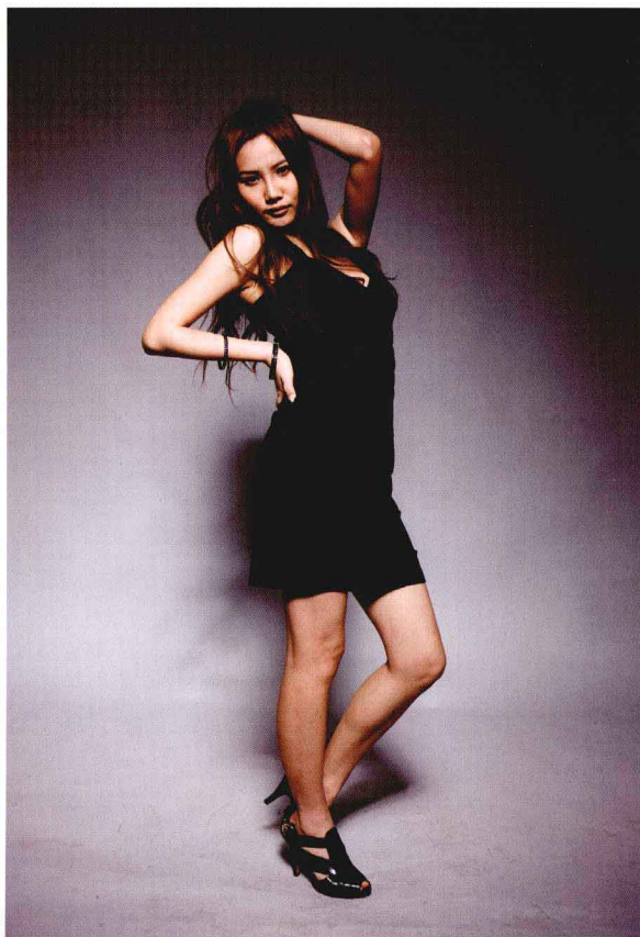
●光圈：f/3.5 ●快门速度：1/125s ISO 感光度：ISO100 ■焦距：42mm