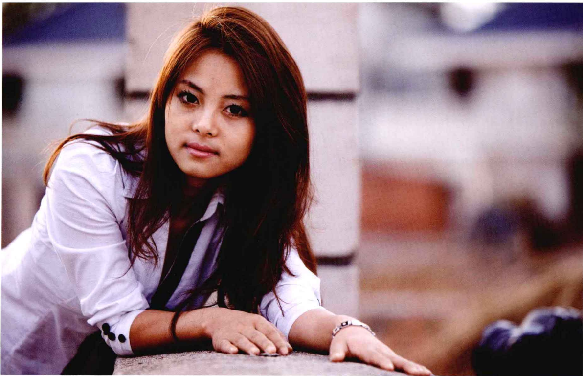
● 光圈：f/2.8 ● 快门速度：1/125s ISO 感光度：ISO100 ■ 焦距：200mm

模特的长发自然垂下来，双手趴在台阶上，迷人的眼神将女人性感的一面表现得淋漓尽致。整个人表现出很放松的状态。