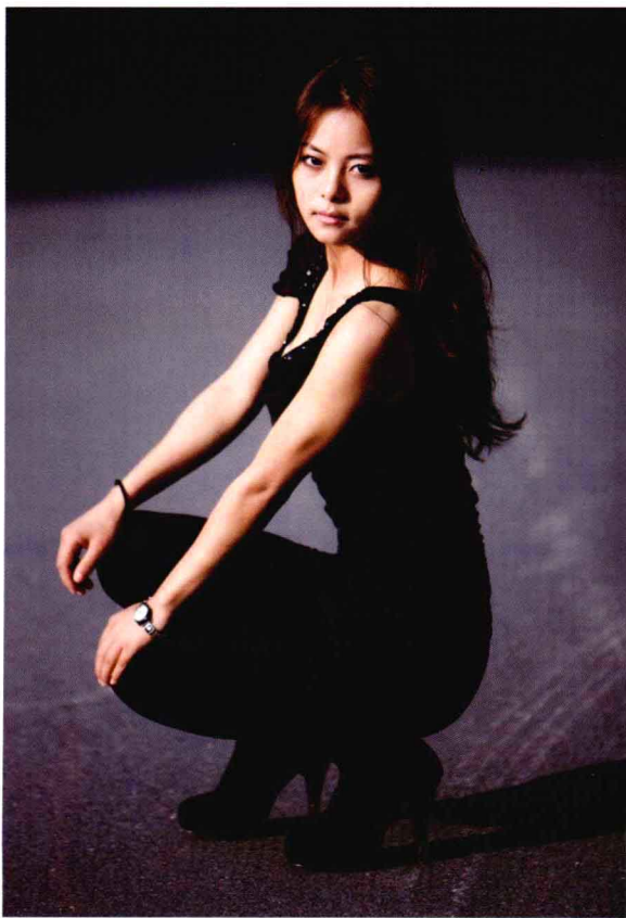
● 光圈：f/2.8 ● 快门速度：1/250s ● ISO 感光度：ISO100 ■ 焦距：125mm