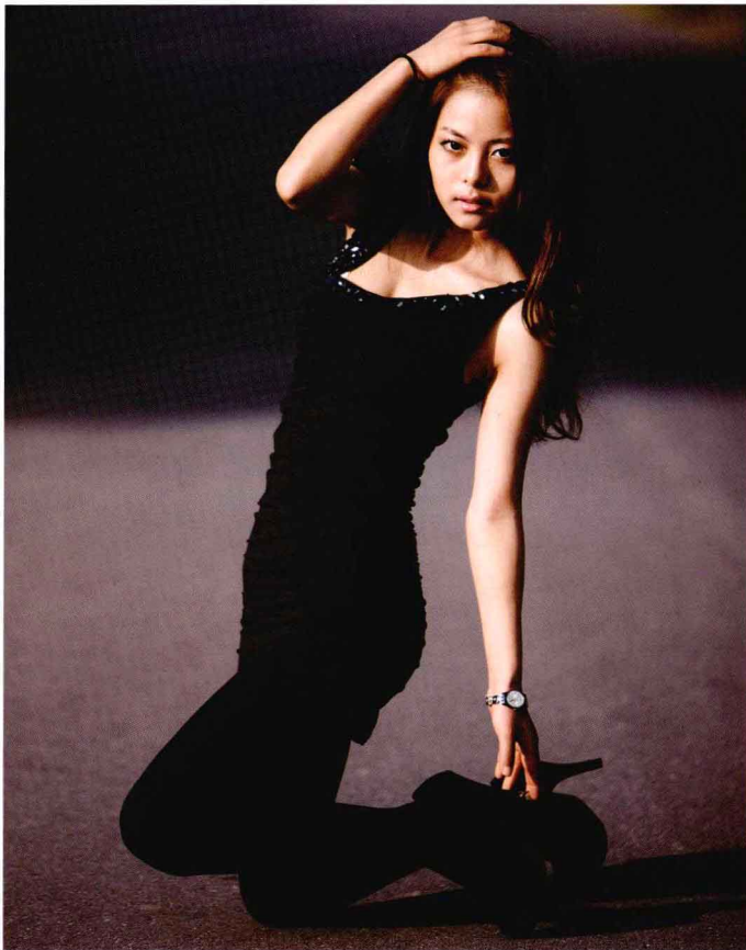
● 光圈：f/2.8 ● 快门速度：1/800s ISO 感光度：ISO100 ■ 焦距：200mm

模特单腿跪地，另一只脚尖着地来保持身体的平衡，模特的一只手放在腿上，另一只手拨弄着自己的头发，腰杆挺拔，整个动作优雅中带着性感。