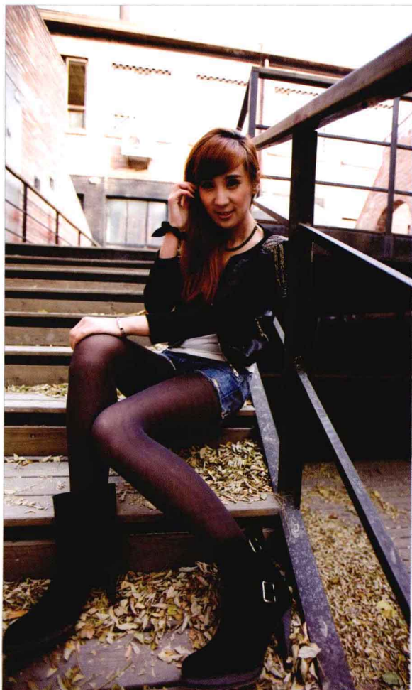
● 光圈: f/8 ● 快门速度: 1/100s ISO 感光度: ISO100 ■ 焦距: 26mm

模特并不是深坐在楼梯上，而是只坐在台阶的1/3处，身体也没靠在身后的栏杆上，双腿的摆放加上广角镜头的使用，模特显得更加修长。