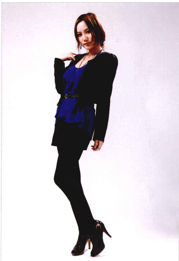
● 光圈：f/8 ● 快门速度：1/125s ISO 感光度：ISO100 ■ 焦距：50mm