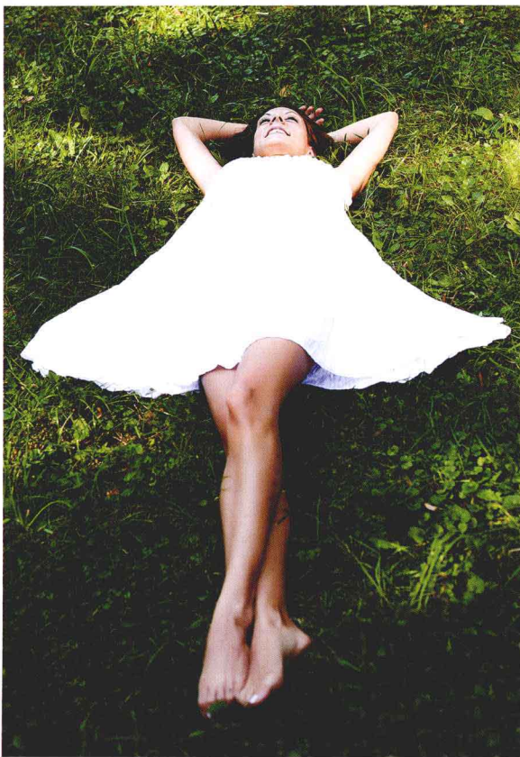
● 光圈：f/8 ● 快门速度：1/200s ISO 感光度：ISO100 ■ 焦距：45mm

模特身着白色连衣裙躺在草地上，将双手放于头顶，两条腿相互叠放，具有很强的造型效果。