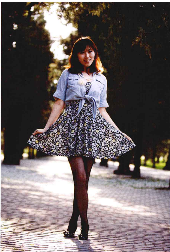
●光圈：f/2.8 ●快门速度：1/500s ISO 感光度：ISO400 ■焦距：70mm