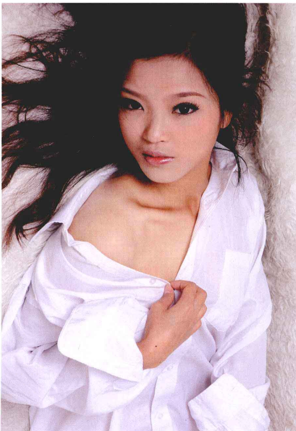
● 光圈：f/8 ● 快门速度：1/200s ISO 感光度：ISO100 ■ 焦距：50mm