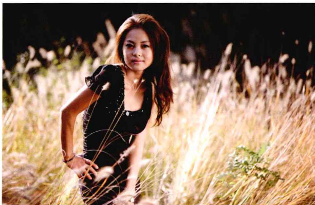
● 光圈：f/2.8 ● 快门速度：1/100s ISO 感光度：ISO100 ■ 焦距：155mm

模特一只手叉腰，另一只手自然地垂放在前面，身体微微向前倾，这个动作很协调也很自然。