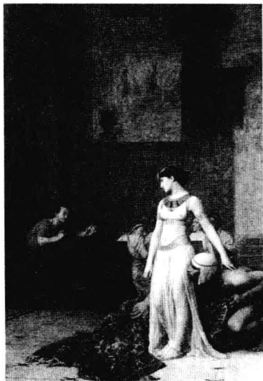
法国画家让-里奥·杰洛姆的油画 《克娄巴特拉和凯撒》，作于 1866 年。

克娄巴特拉诞生于公元前 69 年，死于公元前 30 年。她不是埃及人，兼具马其顿人、希腊人和波斯人的血统，她是亚历山大大帝手下的马其顿将军托勒密·索特尔的后裔。亚历山大大帝死后，帝国陷入四分五裂，留守埃及的索特尔建立起托勒密王朝，自称托勒密一世，克娄巴特拉是这个王朝最后的一位统治者。托勒密家族承袭了埃及人近亲婚配的制度，只在皇族