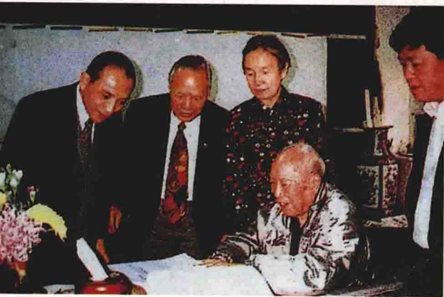
艺术大师黎雄才 先生参阅黎氏宗祠设 计图后欣喜为珠玑巷 黎氏宗祠亲题墨宝。

中图为94岁高龄的艺术大师黎雄才老先生挥毫题词赠给粤北著名的南雄中学。文曰：学问之道，劳而不获者有之矣，未劳而获者也有之。