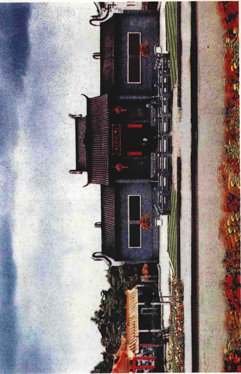
图 为南雄珠玑巷黎氏宗祠外景，门上黎氏宗祠四个字是由广州美术学院教授、著名画家、九十四岁高龄的黎雄才先生亲题墨宝。