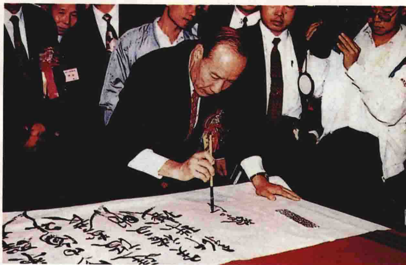
1994年10月，广州市市长黎子流一行到南雄珠玑古巷观光考察，并即席挥毫为珠玑古巷题词：“群策群力海内外上建设发展富裕文明新珠玑。”