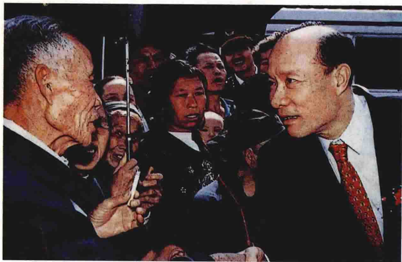
1994年10月，广州市市长黎子流（右）与珠玑古巷村民亲切交谈。