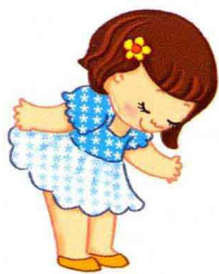
亲子游戏 真果果 主编

出版发行 中国人口出版社 印 刷 北京卡乐富印刷有限公司 开 本 889毫米×1194毫米 1/20 印 张 8 版 次 2012年6月第1版 印 次 2012年6月第1次印刷 书 号 ISBN 978-7-5101-1241-6 定 价 50.00元 (全5册)