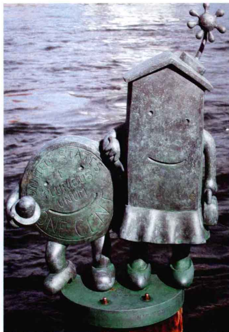
户外雕塑公共艺术