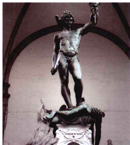
欧洲街头纪念性公共艺术雕塑