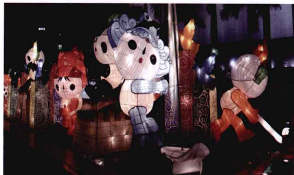
同灯光相结合的城市公共艺术