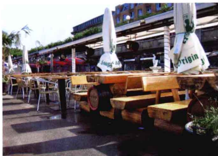
广场休憩休闲场所