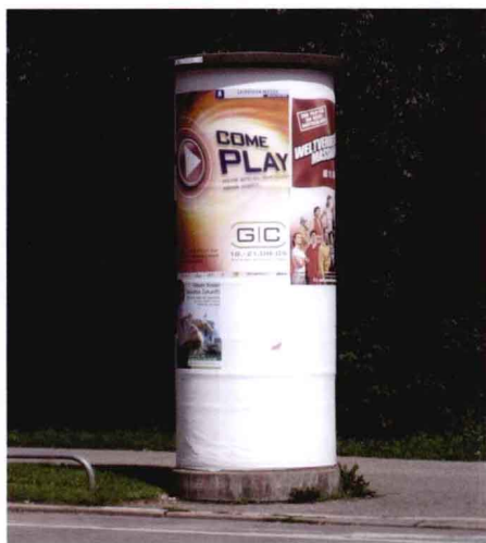
广告同灯柱相结合的城市公共艺术