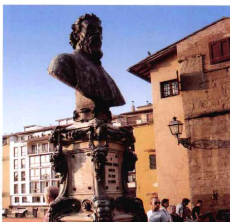
美国街头城市雕塑