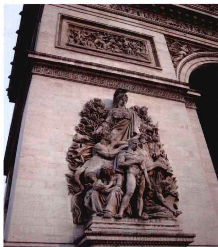
凯旋门上的浮雕图案