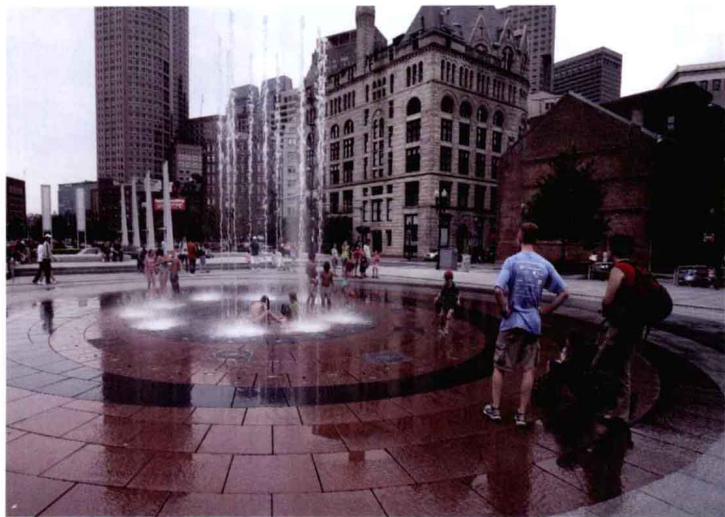
波士顿城市广场的旱喷具有极强的参与性，推动着城市文明的发展。

城市公共艺术是一种大众的艺术，本土精神文化是其灵魂，表现形式只能是艺术性的外衣。