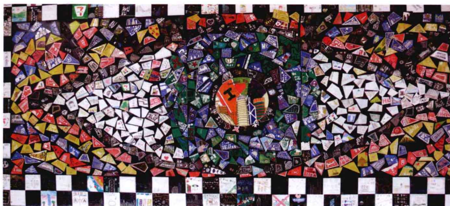
装饰性公共艺术地景