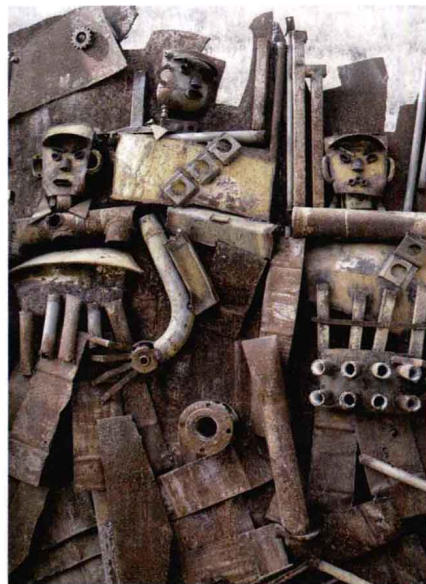
用废旧钢铁来创作的 城市公共艺术 提示人们低碳环保，同时主题也具有教化意义。