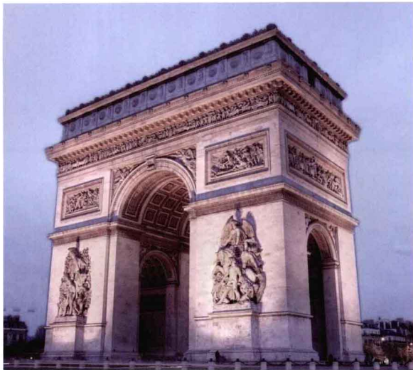
大批类似凯旋门这样优秀的公共艺术将具有历史的永恒性。

很多具有历史记忆的作品也会使人们在历史行程中、在文化积淀中回味反省和深思人类自己。在一些欧洲城市，往往从一座座街头雕像就能读出某个国家的内涵，就可以领略到西方不同国家与不同民族的文化 and 历史。