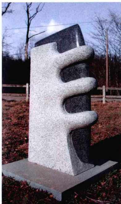
户外雕塑公共艺术