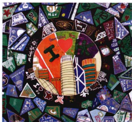
装饰性公共艺术地景