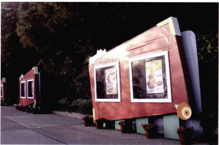
广告性质的城市公共艺术