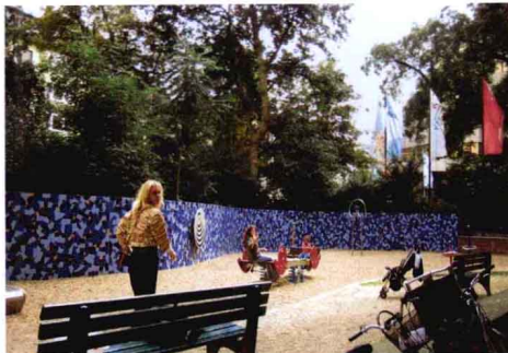
街角活动休闲公共艺术