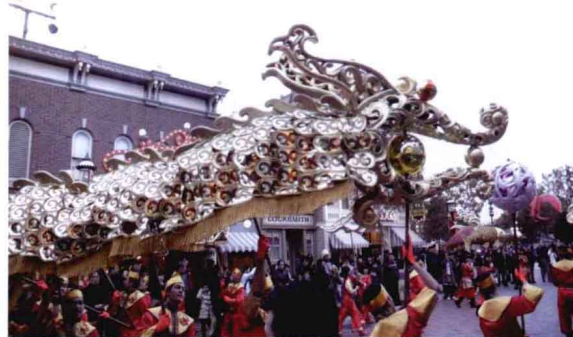
以龙文化为主题的庆典艺术