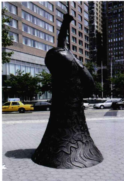
开放空间中独立的 城市公共艺术

城市公共艺术是城市景观设计的组成部分，但作为艺术作品本身也有自己的主张及个性体现。尽管城市公共艺术被看作是城市的组成元素之一，但同时我们也可以把它看作是独立的艺术品。城市公共艺术具有多元的特性与气场，处于一个开放的空间中。