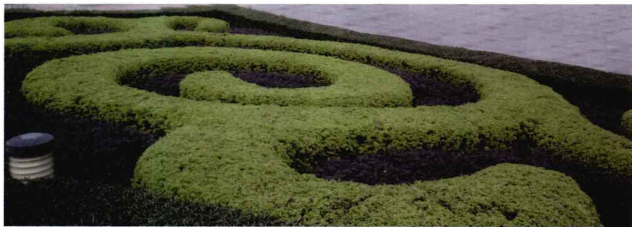
园艺雕塑形成的几何化城市公共艺术