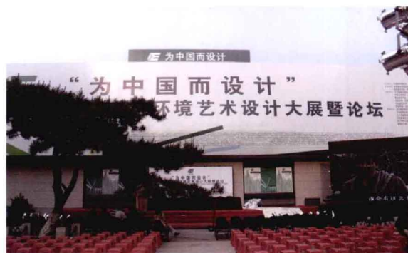
同活动相结合的广义的公共艺术形态

城市公共艺术能够讲述城市的故事，人们可以由此找到不同地域文化，城市文明也因此得以继承和传播，这是功能化设施无法给予的。因此，城市公共艺术具有超越功能需求的现实价值意义。