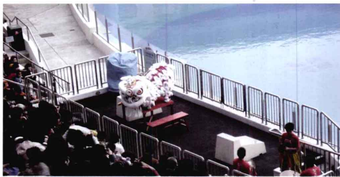
公开的表演艺术也可纳入广义的公共艺术。