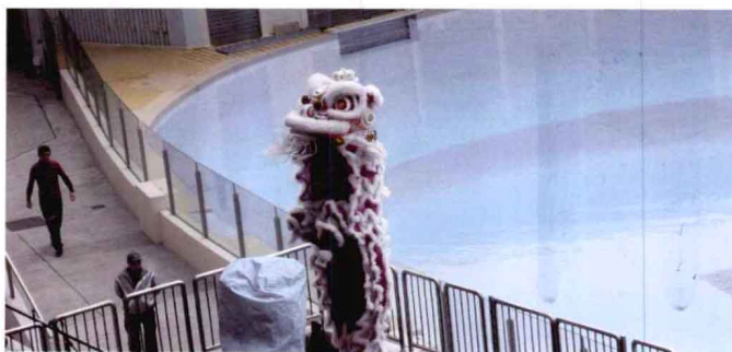
公开的表演艺术也可纳入广义的公共艺术。

还包括由公众兴办或参与的公开的表演艺术和其他公开的动态艺术活动,以及广泛的社会人群进行相互交流和沟通的、具有某种描述作用的艺术形式。