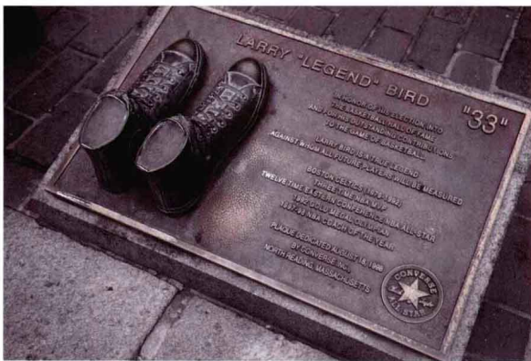
通过人们最熟知的事物来表达城市公共艺术的内在意义。