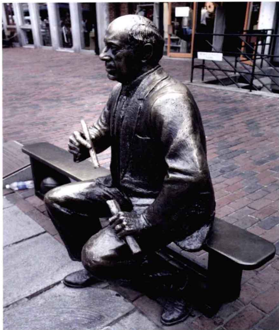
波士顿城市广场的景观雕塑