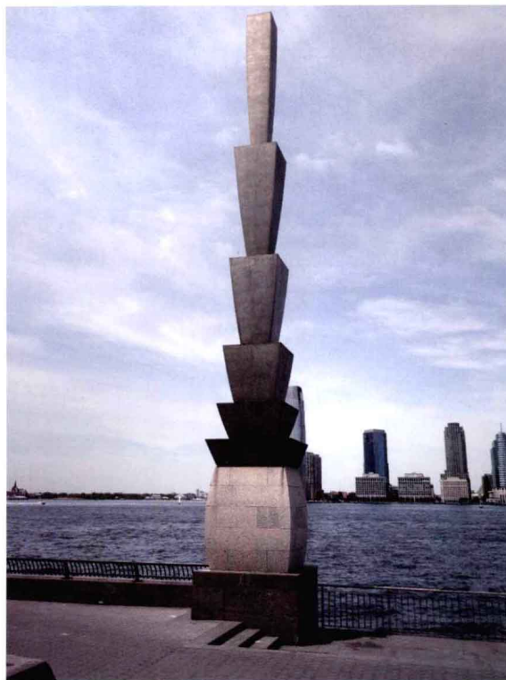
节点处的海滨雕塑对环境景观整体有提升的作用。