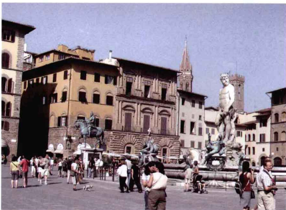
通过街头的公共艺术就能明晓一个城市的文化、历史和价值取向。