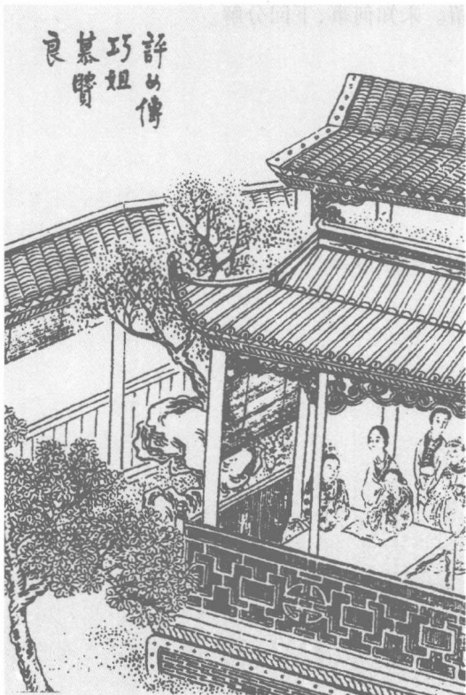
评女传巧姐慕贤良

宝玉点头道：“我也知道，如今且不用说那个。我问你，老太太那里打发人来说什么来着没有？”袭人道：“没有说什么。”宝玉道：“必是老太太忘了。明儿不是十一月初一日么，年年老太太那里必是个老规矩，要办消寒会，齐打伙儿坐下，喝酒说笑。我今日已经在学房里告了假了。这会子没有信儿，明儿可是去不去呢？若去了呢，白白的告了假；若不去，老爷知道了，又说我偷懒。”袭人道：“据我说，你竟是去的是，才念的好些儿了，又想歇着。我劝你也该上点紧儿了。昨儿听见太太说，兰哥儿念书真好，他打学房里回来，还各自念书作文章，天天晚上弄到四更多天才睡。你比他大多了，又是叔叔，倘或赶不上他，又叫老太太生气。倒不如明儿早起去罢。”麝月道：“这