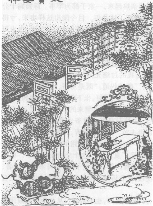
布疑阵宝玉妄谈祥

托，必须打点才好。”王夫人又提起宝钗的事来，因说道：“这孩子也苦了，既是我家的人了，也该早些娶了过来才是，别叫他遭塌坏了身子。”贾政道：“我也是这么想。但是他家忙乱，况且如今到了冬底，已经年近岁逼，无不各自要料理些家务。今冬且放了定，明春再过礼。过了老太太的生日，就定日子娶。你把这番话先告诉薛姨妈太太。”王夫人答应了。