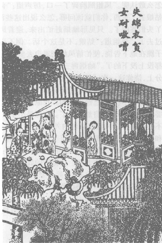
失锦衣贫女耐嗷嘈

从此，凤姐常到园中照料。一日刚走进大观园，到了紫菱洲畔，只听见一个老婆子在那里嚷。凤姐走到跟前，那婆子才瞧见了，早垂手侍立，口里请了安。凤姐道：“你在这里闹什么？”婆子道：“蒙奶奶们派我在这里看守花果，我也没有差错，不料邢姑娘的丫头说我们是贼。”凤姐道：“为什么呢？”婆子道：“昨儿我们家的黑儿跟着我到这里玩了一回，他不知道，又往邢姑娘那边去瞧了一瞧，我就叫他回去了。今儿早起，听见他们丫头说，丢了东西了。我问他丢了什么，他就问起我来了。”凤姐道：“问了你一声，也犯不着生气呀。”婆子道：“这里园子到底是奶奶家里的，并不是他们家里的。我们都是奶奶派的，贼名儿