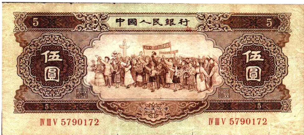
● 第二套人民币 伍圆