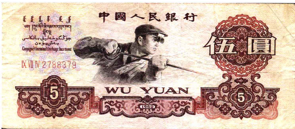
● 第三套人民币 伍圆