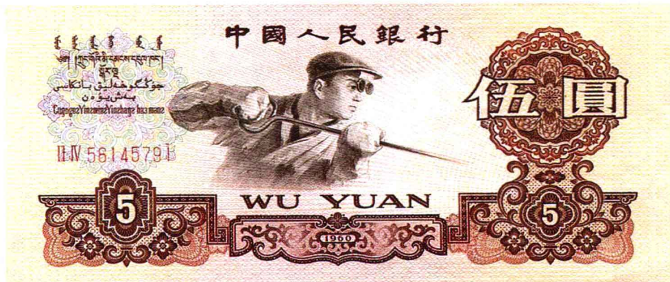
● 第三套人民币 伍圆